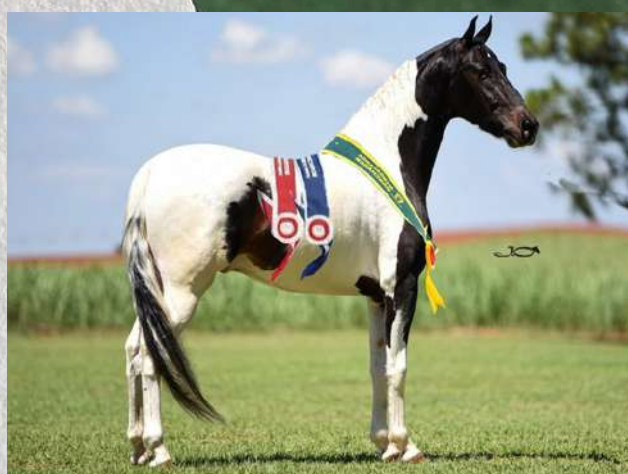
SEU PAI, FAROLETE DA CANDELÁRIA