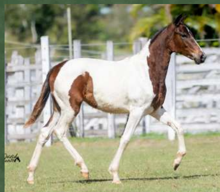
CARMELA DA GINGA