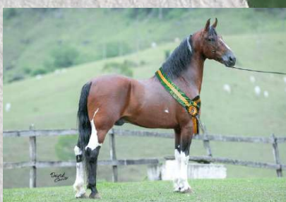
SEU PAI, TARÔ BAVÁRIA