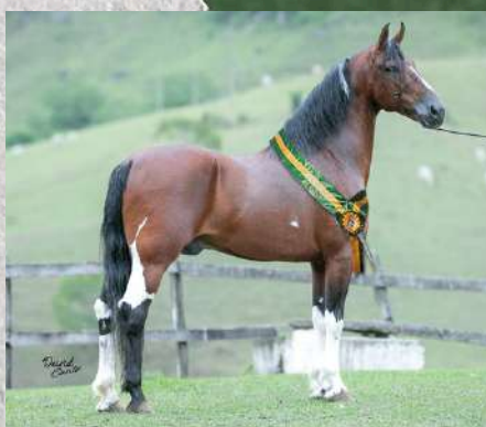
SEU PAI, TARÔ BAVÁRIA