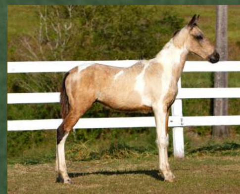
AFAMADO DA GINGA