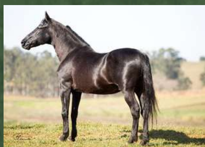
SEU AVÔ, HAITY CAXAMBUENSE