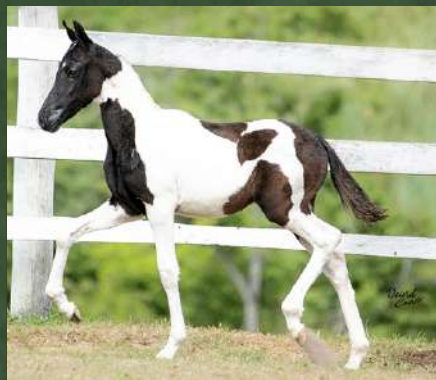
BOTICELLI DA GINGA