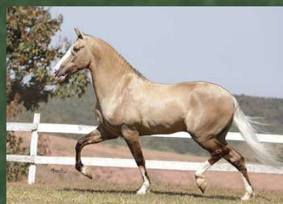
SEU AVÔ, APOLO DA AGROTEXAS