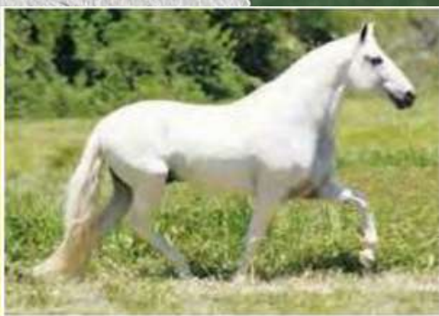
SEU PAI, FAVACHO DIAMANTE