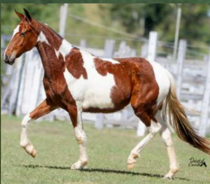
BABUSKA DA GINGA