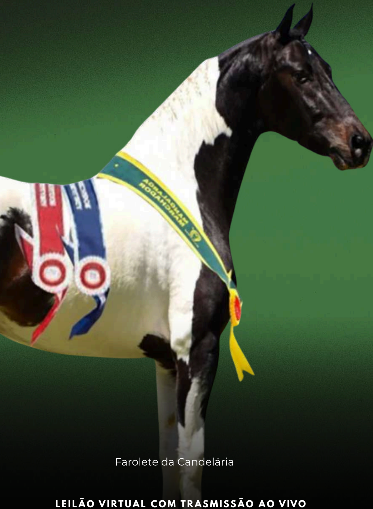
Farolete da Candelária