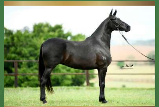
Águia do Zel - 50% ou 100% MARCHA PICADA - Doadora