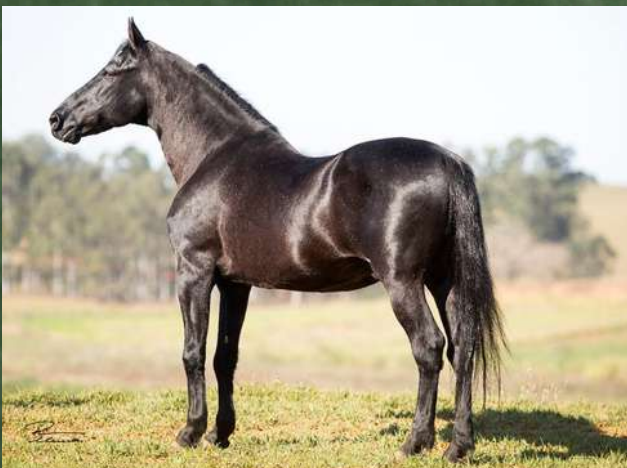
SEU BISAVÔ, HAITI CAXAMBUENSE