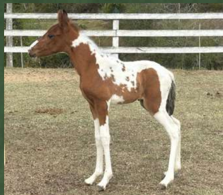
CAPITU DA GINGA