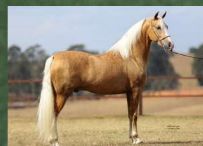
DIREITO A COBERTURA POR DINÂMICO DO ZEL