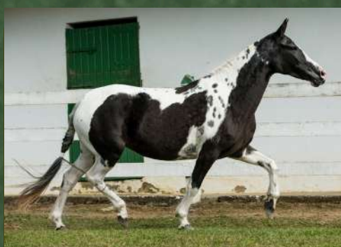
SUA MÃE, NINFETA UNIVERSAL DA GINGA