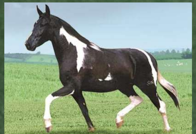
SUA MÃE, BELEZA NEGRA DA GINGA