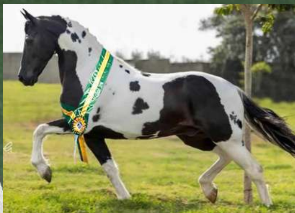
SEU PAI, DIADEMA DE PASSA TEMPO