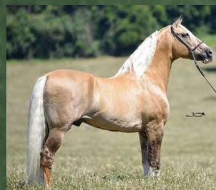
SEU AVÔ, FATOR DA CAVARÚ-RETÃ