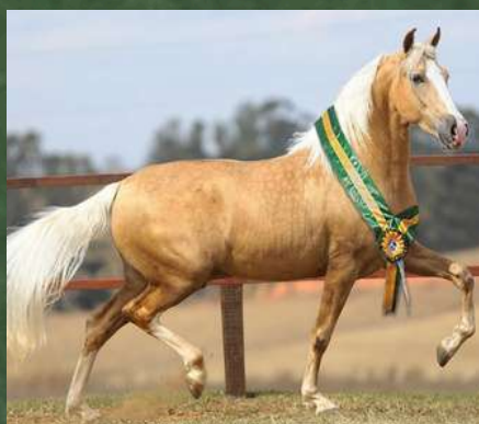
DIREITO A COBERTURA POR DINÂMICO DO ZEL