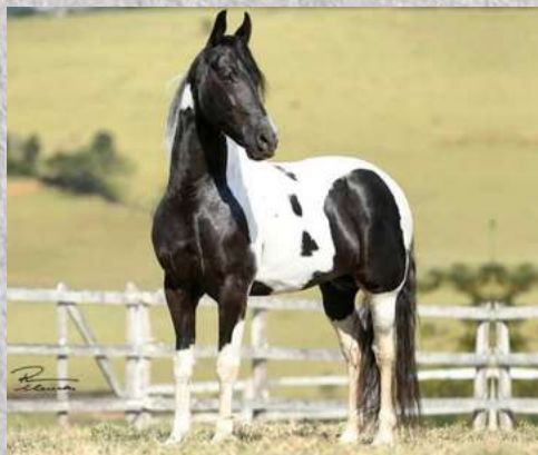
SEU PAI, DIADEMA DE PASSA TEMPO