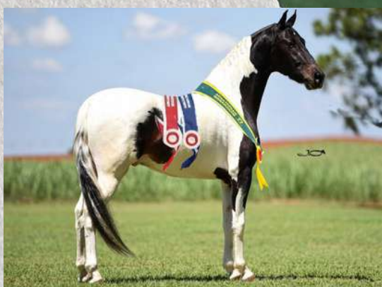
SEU PAI, FAROLETE DA CANDELÁRIA