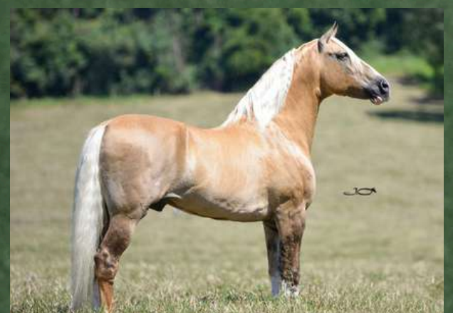
SEU AVÔ, FATOR DA CAVARÚ-RETÃ