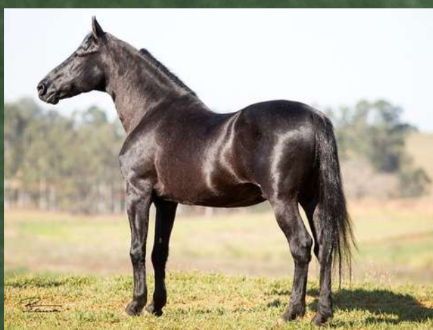
SEU BISAVÔ, HAITY CAXAMBUENSE