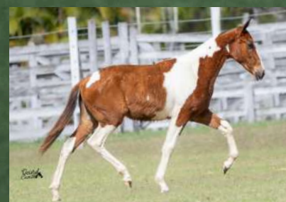
SUA FILHA, CARIBENHA DA GINGA