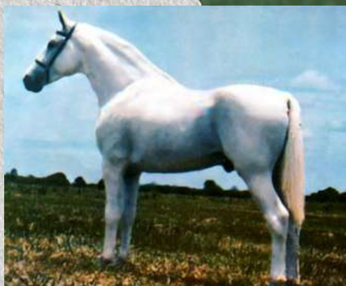
SEU AVÔ, HERDADE PRATEADO