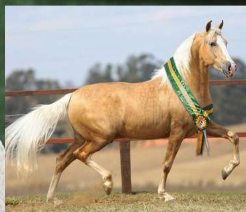
EMBRIÃO POR DINÂMICO DO ZEL