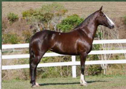
SUA MÃE, HONRA DA MURALHA DE PEDRA