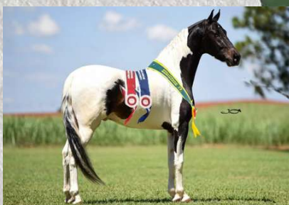
SEU PAI, FAROLETE DA CANDELÁRIA