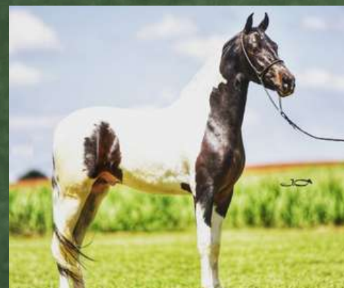
DIREITO A COBERTURA POR FAROLETE DA CANDELÁRIA