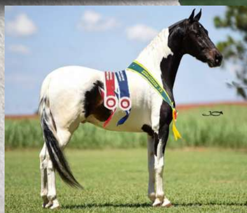
EMBRIÃO POR FAROLETE DA CANDELÁRIA