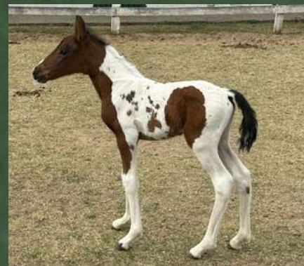
CADILLAC DA GINGA