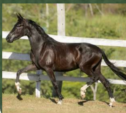
DESBRAVADOR TE DO ZEL