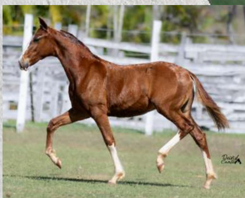
CORCEL DA GINGA