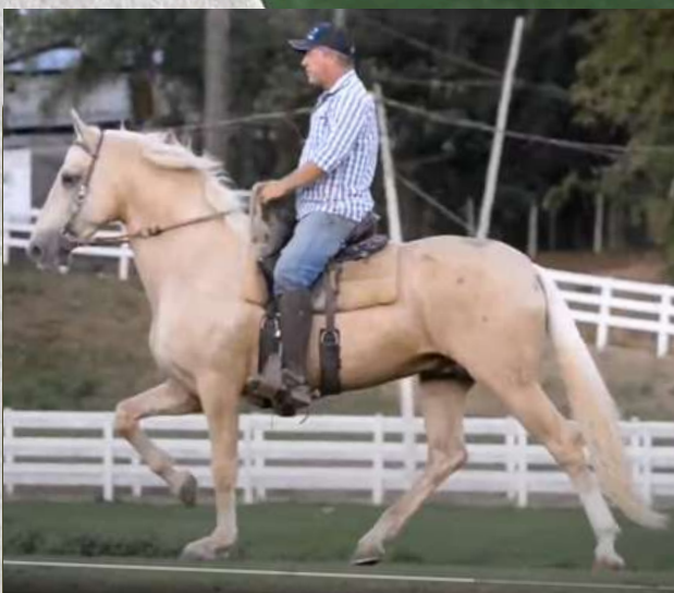
EMBRIÃO POR CEDRO DA CALCIOLÂNDIA