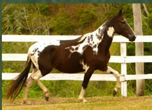
SUA MÃE, TODA LINDA ZT DA GINGA