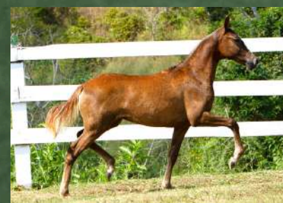
SUA FILHA, ABUSADA DA GINGA (RESERVA ABSOLUTA DE PANTEL)