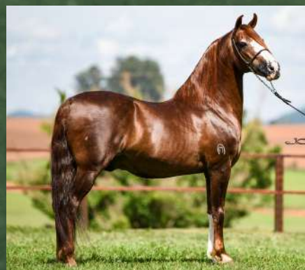
EMBRIÃO POR GALANTE DO EXPOENTE