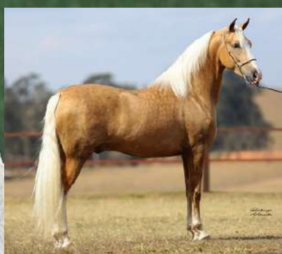
DINÂMICO DO ZEL