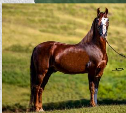
SEU PAI, GALANTE DO EXPOENTE