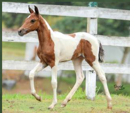
BOA MENINA DA GINGA