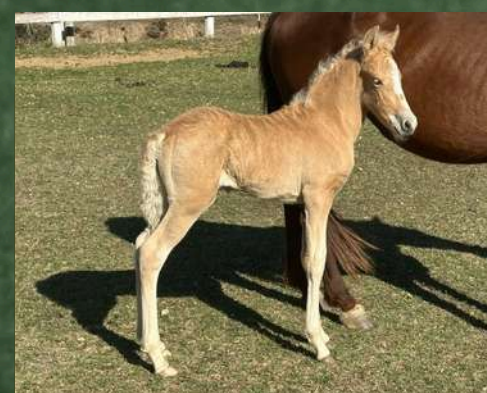
COLORIDO DA GINGA