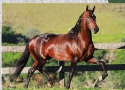
SEU PAI, DADO CAPIM FINO