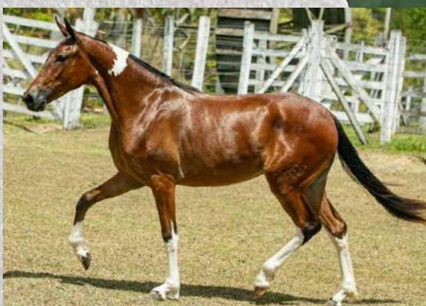
ANABELLA DA GINGA