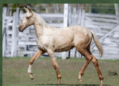
SUA NETA, CALLIENTE DA GINGA