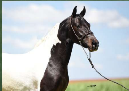
DIREITO A COBERTURA POR FAROLETE DA CANDELÁRIA