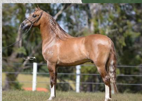
SEU PAI, CLONE DO SALTO BOA VISTA