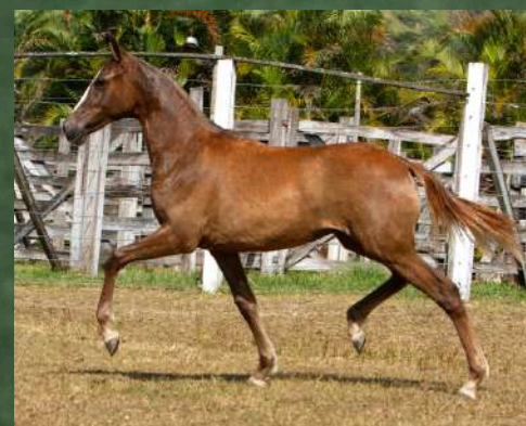
ABUSADA DA GINGA