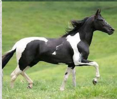
SEU AVÔ, TALISMÃ KAFÉ