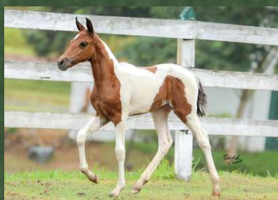
SUA FILHA, BOA MENINA DA GINGA POR FAROLETE DA CANDELÁRIA (RESERVA ABSOLUTA DE PLANTEL)