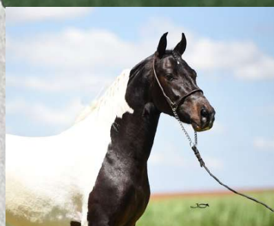
DIREITO A COBERTURA POR FAROLETE DA CANDELÁRIA