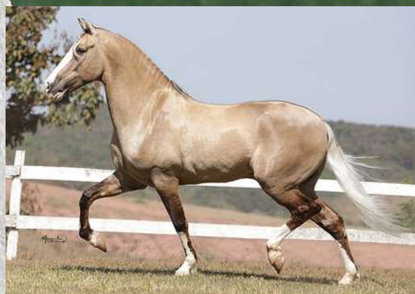
SEU PAI, APOLO DA AGROTEXAS