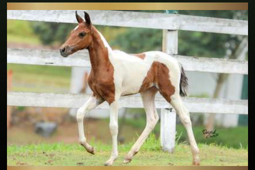
Boa Menina da Ginga - 50% MARCHA PICADA - Filha do Farolete