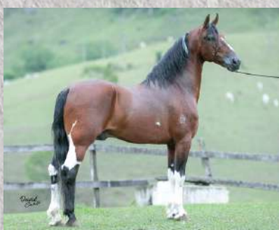
SEU PAI, TARÔ BAVÁRIA