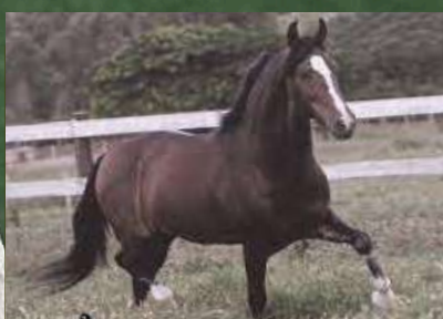
SEU AVÔ, FAVACHO ÚNICO