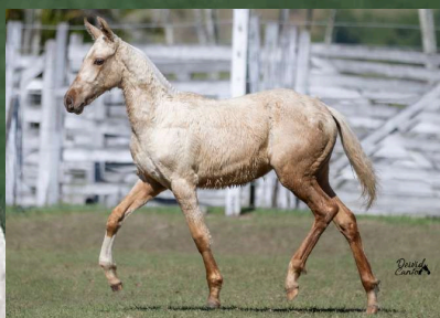
SUA NETA, CALLIENTE DA GINGA