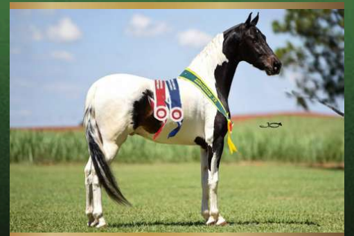
Farolete da Candelária