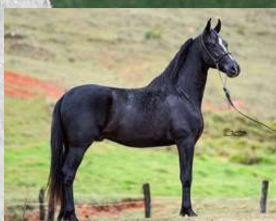
SEU PAI, CLONE HAITY TN1