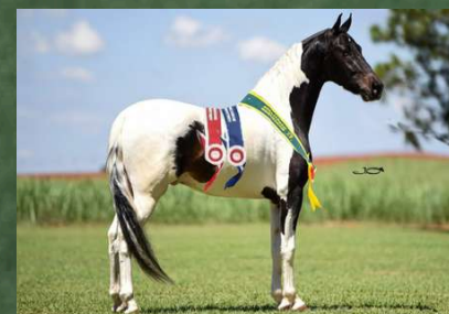
DIREITO A COBERTURA POR FAROLETE DA CANDELÁRIA