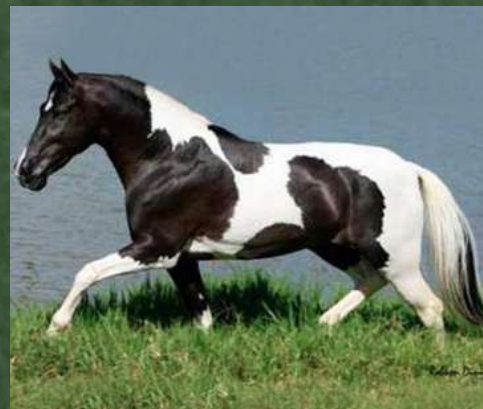
SEU BISAVÔ, ÍNDIO DE PASSA TEMPO