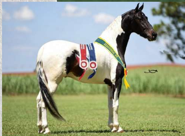
SEU PAI, FAROLETE DA CANDELÁRIA