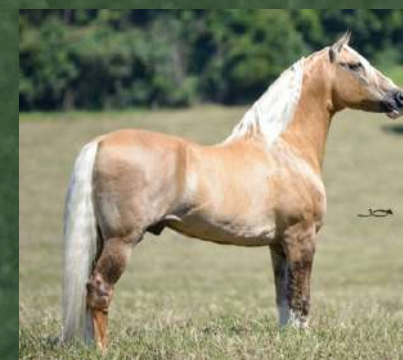
SEU AVÔ, FATOR DA CAVARU-RETÃ