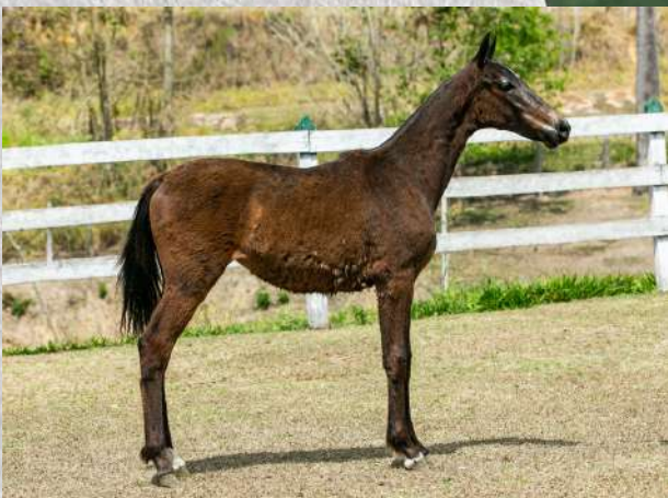
BARBARELLA DA GINGA