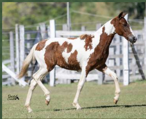
COISA LINDA DA GINGA