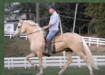
EMBRIÃO POR, CEDRO DA CALCIOLÂNDIA

PREÇOS PROMOCIONAIS SOMENTE NESTE LEILÃO