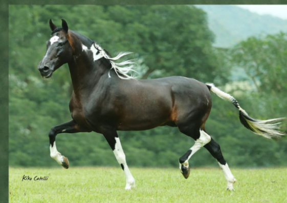
SEU BISAVÔ, SUBLIME DA OGAR