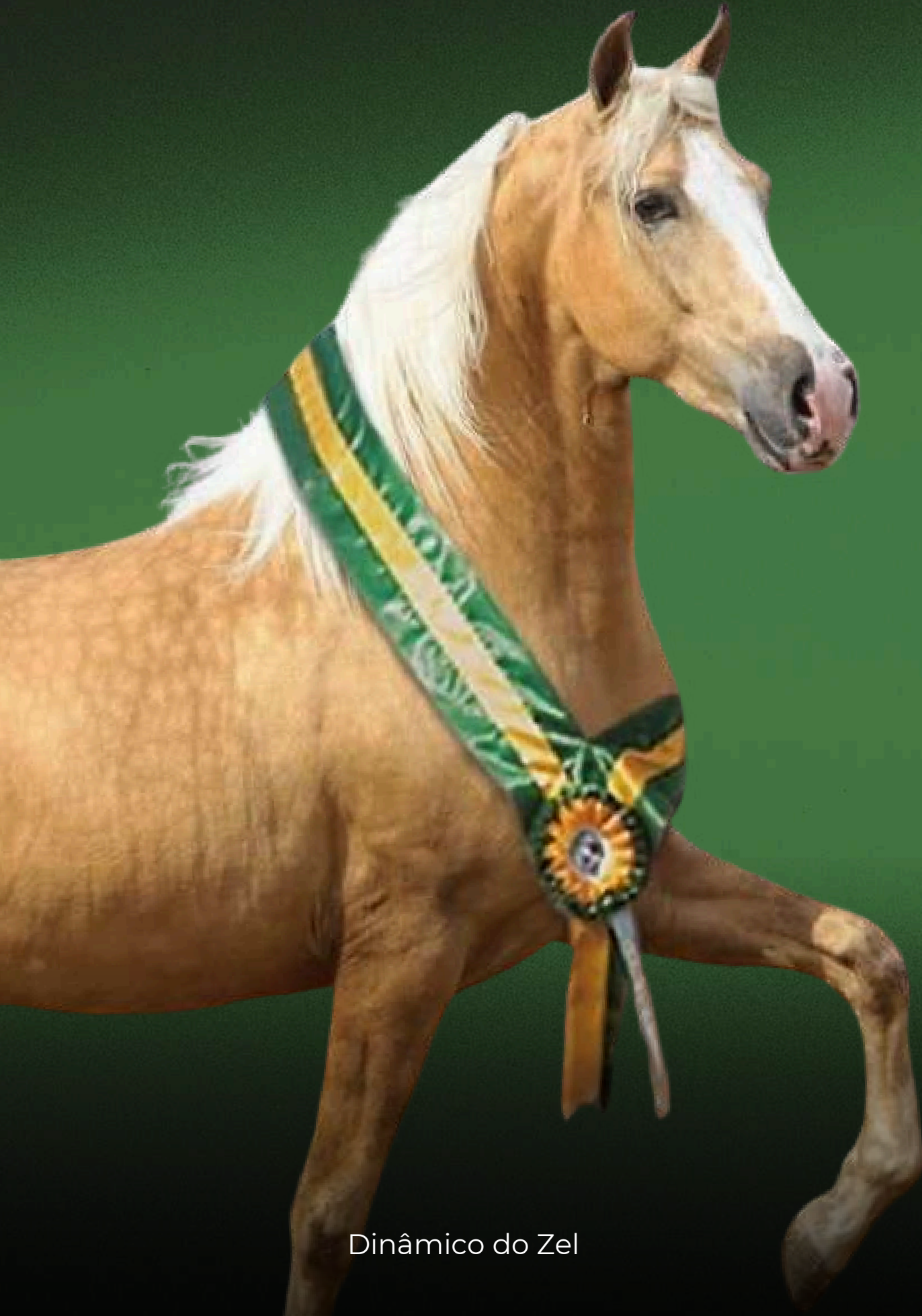
Dinâmico do Zel