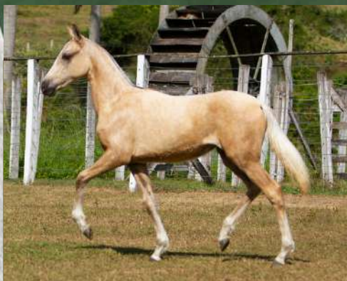
AFRODITE DA GINGA