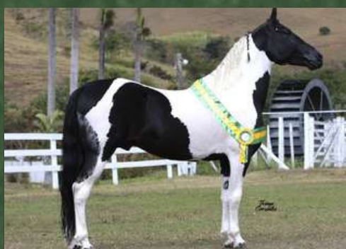
SEU AVÔ, UNIVERSAL DA SANTA ESMERALDA