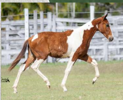
CARIBENHA DA GINGA