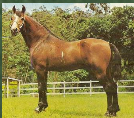
SEU TRISAVÔ, HERDADE CADILAC