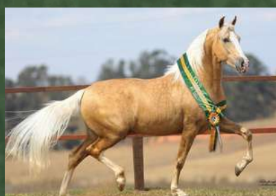
DINÂMICO DO ZEL (PAI DA CARIBENHA DA GINGA)