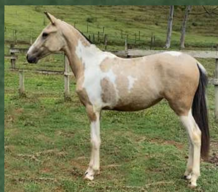
OLINDA GINGA DO CABALLÚ