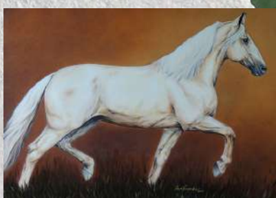
SEU PAI, FAVACHO OUTONO