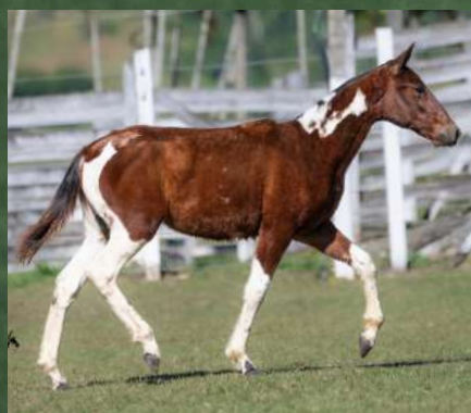
CHIC DA GINDA