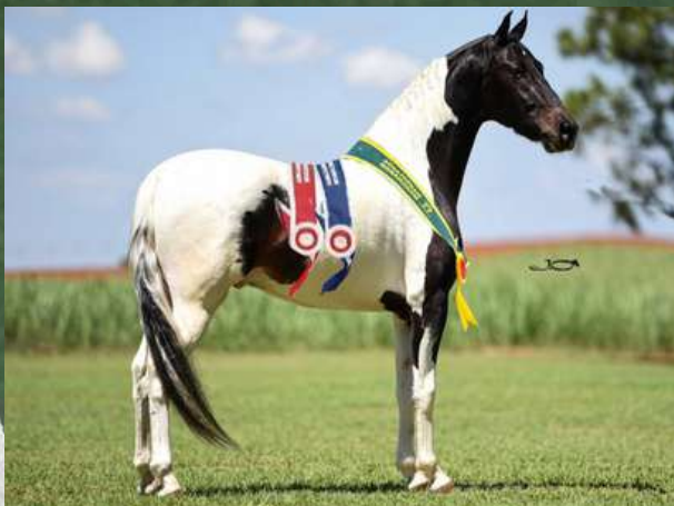
SEU PAI, FAROLETE DA CANDELÁRIA