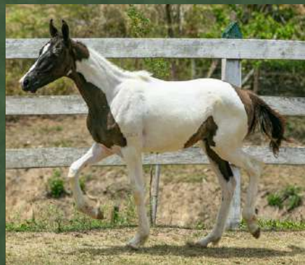
BAGATELLI DA GINGA