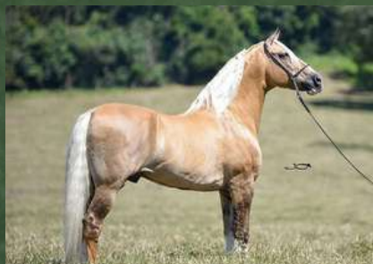
SEU AVÔ, FATOR DA CAVARÚ-RETÃ