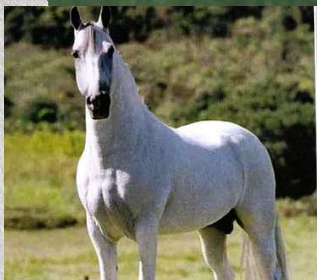
SEU AVÔ, S.B. ORPHEU