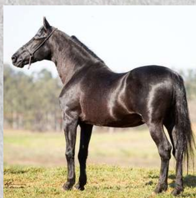
SEU AVÔ, HAITY CAXAMBUENSE