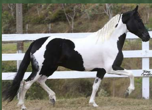
SEU AVÔ, UNIVERSAL DA SANTA ESMERALDA