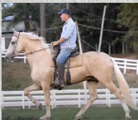
EMBRIÃO POR CEDRO DA CALCIOLÂNDIA