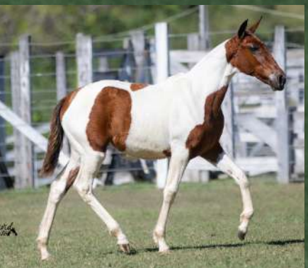
CARIOQUINHA DA GINGA