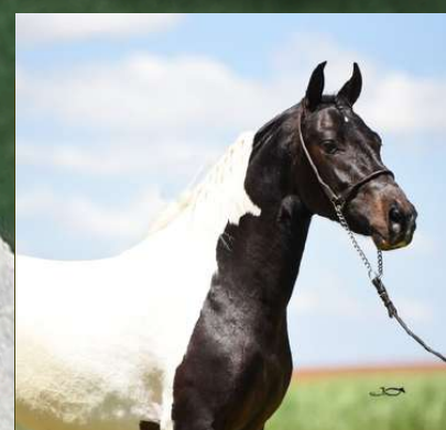
FAROLETE DA CANDELÁRIA