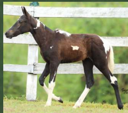
BABILÔNIA DA GINGA