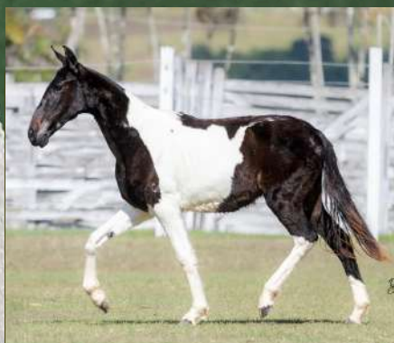
BALADINHA DA GINGA