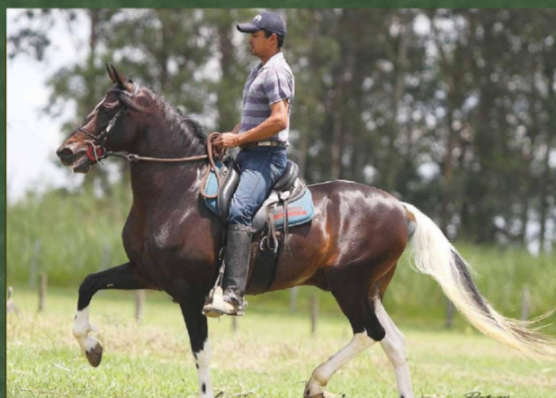
SEU BISAVÔ, COMBOIO DO EXPOENTE