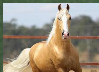
DIREITO A COBERTURA POR DINÂMICO DO ZEL

• VENTRE DE OURO QUE SÓ ESTÁ SENDO DISPONIBILIZADA POR TER DEIXADO LINDA POTRINHA NA RESERVA DE PLANTEL.