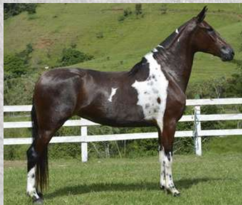
SUA MÃE, OHANA ELO DA GINGA