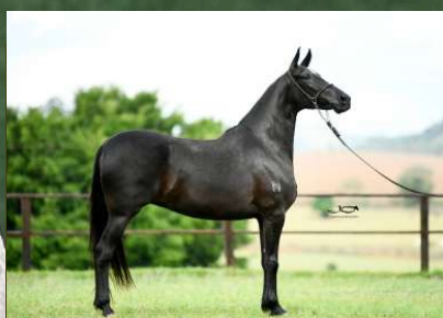
SUA MÃE, ÁGUIA DO ZEL