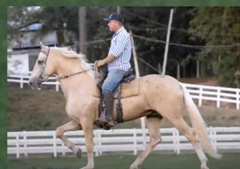
EMBRIÃO POR, CEDRO DA CALCÍOLÂNDIA

PREÇOS PROMOCIONAIS SOMENTE NESTE LEILÃO