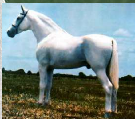
SEU BISAVÔ, HERDADE PRATEADO