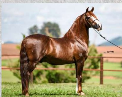
SEU AVÔ, GALANTE DO EXPOENTE