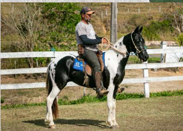
ZORRO NEGRO DA GINGA