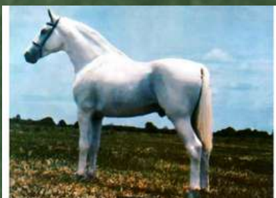
SEU BISAVÔ, HERDADE PRATEADO