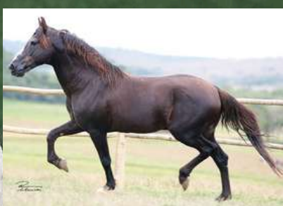
SEU BISAVÔ, TRILHO DA ZIZICA