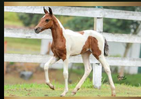
Boa Menina da Ginga - 50% MARCHA PICADA - Filha do Farolete