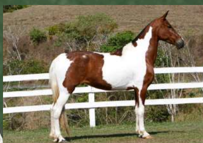
SUA MÃE, FRAGATA DO CABALLÚ