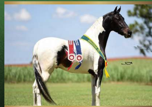
Farolete da Candelária