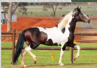
SEU AVÔ, ELO KAFÉ DA NOVA