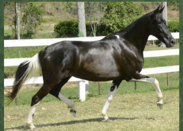
SUA MÃE, JOIA NEGRA DA GINGA