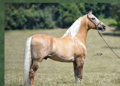
SEU BISAVÔ, FATOR DA CAVARÚ-RETÃ