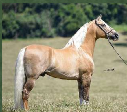
SEU AVÔ, FATOR DA CAVARÚ-RETÃ