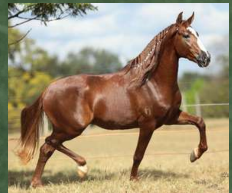
SEU PAI, FATOR DA MORADA NOVA

PREÇOS PROMOCIONAIS SOMENTE NESTE LEILÃO