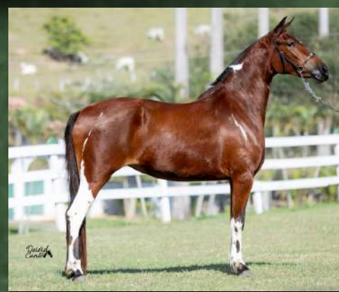
ZABALLA TARÔ DA GINGA

PREÇOS PROMOCIONAIS SOMENTE NESTE LEILÃO