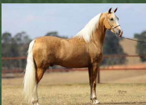
EMBRIÃO POR, DINÂMICO DO ZEL