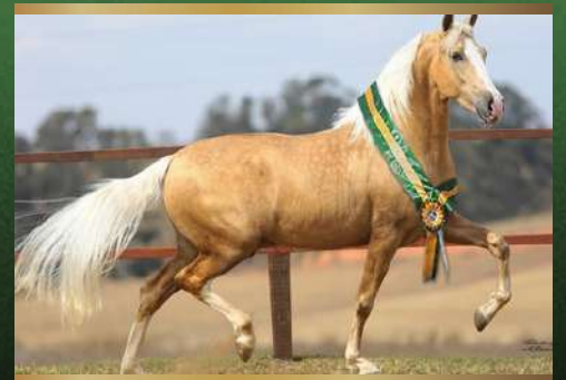
Dinâmico do Zel