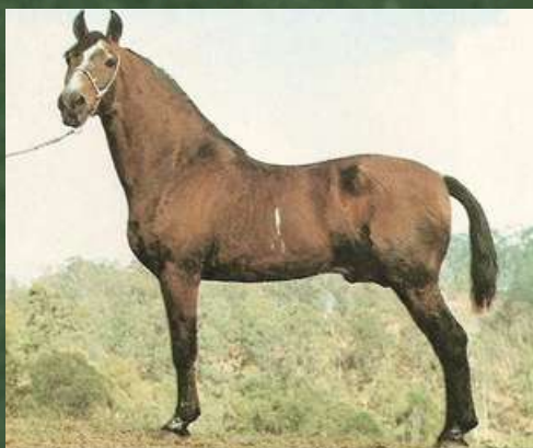
SEU BISAVÔ, HERDADE CADILAC