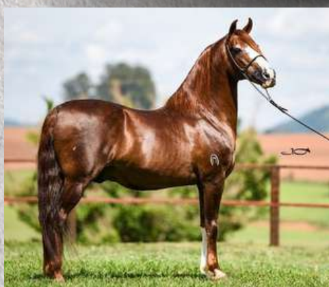
EMBRIÃO POR GALANTE DO EXPOENTE