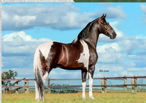
SEU AVÔ, DELETE CAXAMBUENSE