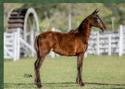
COROADA DA GINGA