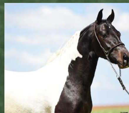
DIREITO A COBERTURA POR, FAROLETE DA CANDELÁRIA