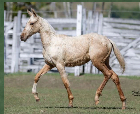
CALLIENTE DA GINGA