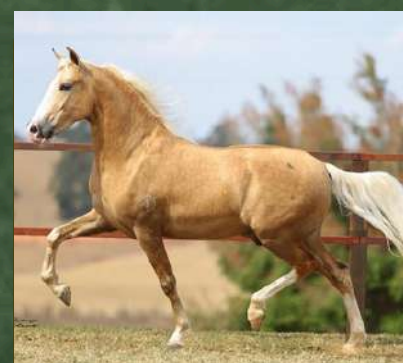
DINÂMICO DO ZEL