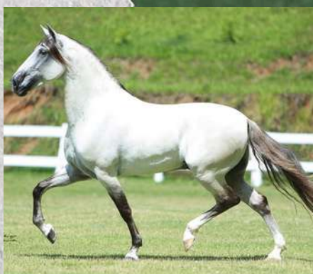
SEU PAI, EMBALO NOVA ESTÂNCIA