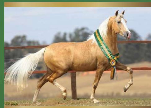
Dinâmico do Zel