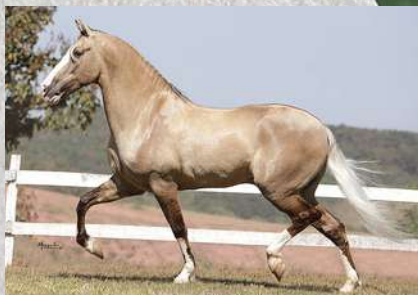
SEU PAI, APOLO DA AGROTEXAS