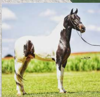
FAROLETE DA CANDELÁRIA