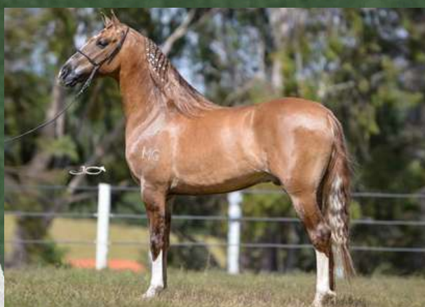
SEU PAI, CLONE DO SALTO BOA VISTA