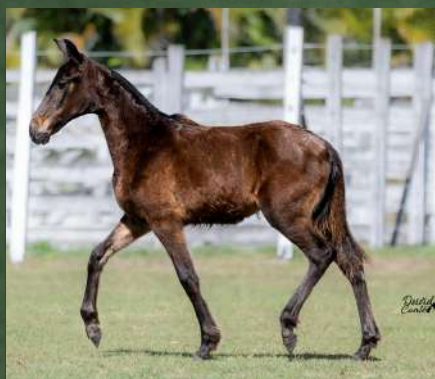
COROADA DA GINGA