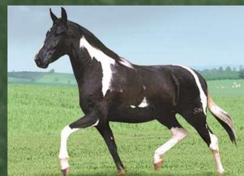
SUA AVÓ, BELEZA NEGRA DA GINGA