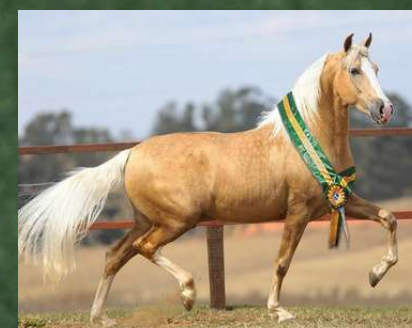
OU DIREITO A COBERTURA POR DINÂMICO DO ZEL