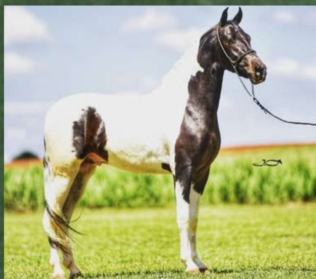
DIREITO A COBERTURA POR FAROLETE DA CANDELÁRIA