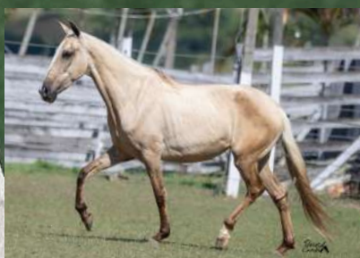
SUA MÃE, X LOIRA FATOR DA GINGA