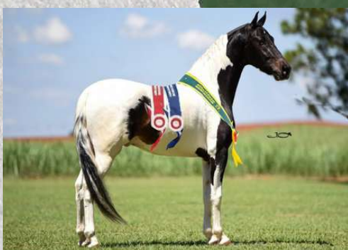
SEU PAI, FAROLETE DA CANDELÁRIA