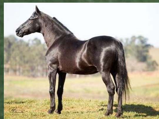
SEU BISAVÔ, HAITY CAXAMBUENSE

• POTRA DE FUTURO, SENDO UMA DAS MELHORES POTRAS NASCIDAS NO PLANTEL GINGA. O COMPRADOR TEM A OPÇÃO DE 50% OU 100%.