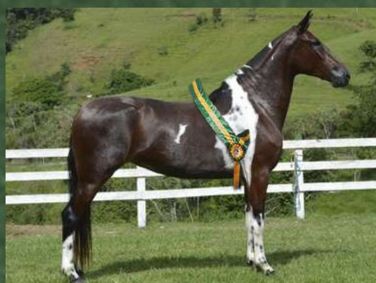
SUA MÃE, OHANA ELO DA GINGA