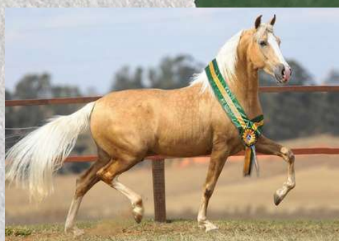
SEU PAI, DINÂMICO DO ZEL