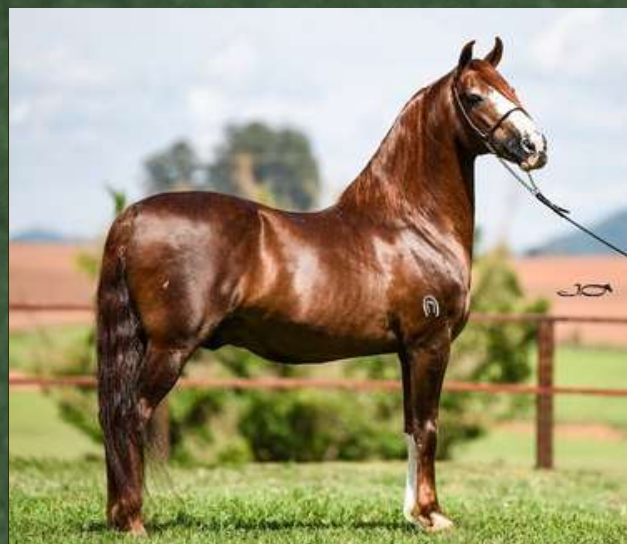
EMBRIÃO POR GALANTE DO EXPOENTE