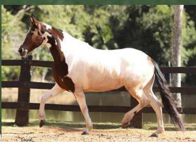
SUA MÃE, GRANADA CAPIM FINO