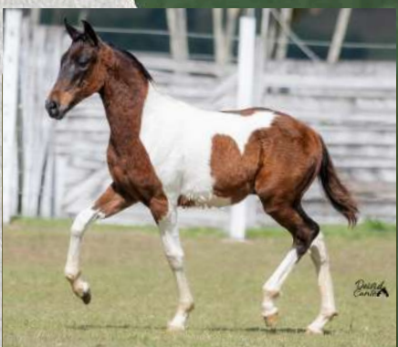
CORINGA DA GINGA