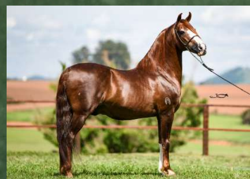
SEU AVÔ, GALANTE DO EXPOENTE