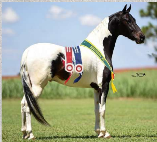
EMBRIÃO POR FAROLETE DA CANDELÁRIA

VALOR PELO EMBRIÃO - PREÇO FIXO DE R$250,00 DE PARCELA NAS CONDIÇÕES DO LEILÃO.