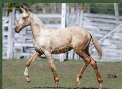
SUA FILHA, CALLIENTE DA GINGA (RESERVA ABSOLUTA DE PLANTEL)