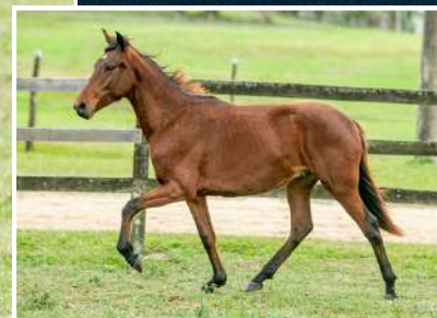
JATO IZ KM 47