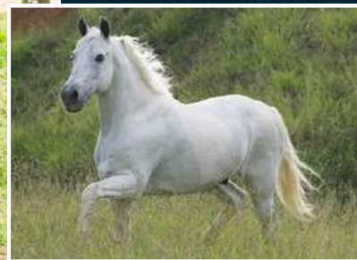
SEU BISAVÔ, GALEÃO DA OGAR