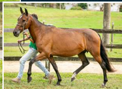
SUA MÃE, AMORA IZ KM 47