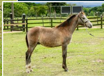
SEU FILHO COM FEITIÇO CAXAMBUENS, LÍRIO IZ KM 47