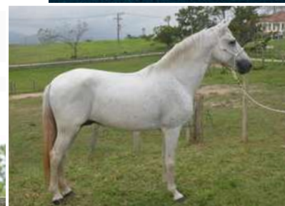
SEU PAI, QUARTZO IZ KM 47