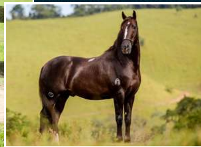
SEU AVÔ, FOGUETE CAXAMBUENSE