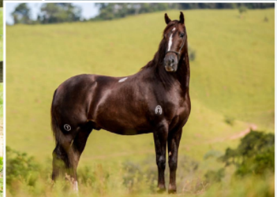
SEU AVÔ, FOGUETE CAXAMBUENSE