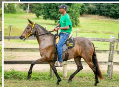
ESFINGE II IZ KM 47