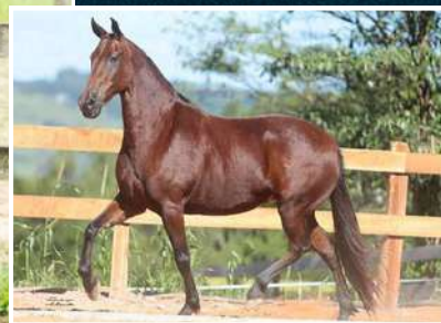
SUA BISAVÓ, XANGRILÁ CAXAMBUENSE