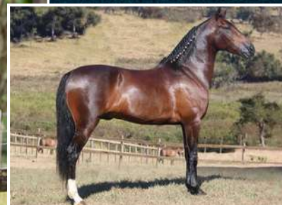
SEU PAI, KAVIAR CAXAMBUENSE