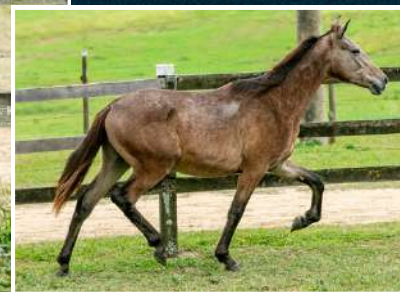
JATOBÁ IZ KM 47