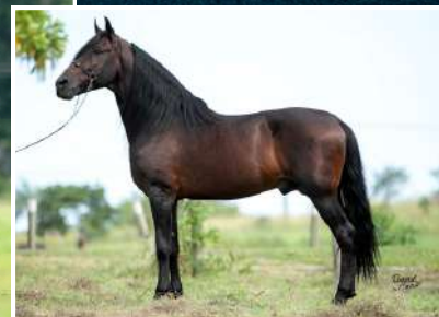
SEU PAI, XERIFE IZ KM 47