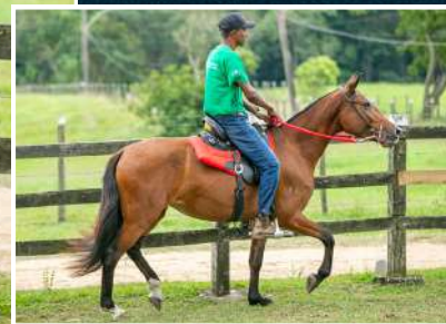
HOPE IZ KM 47