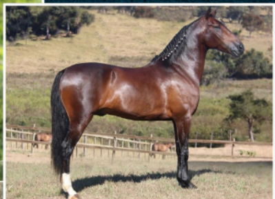
SEU PAI, KAVIAR CAXAMBUENSE