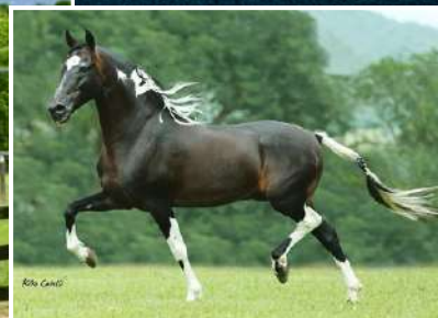
SEU AVÔ, SUBLIME DA OGAR