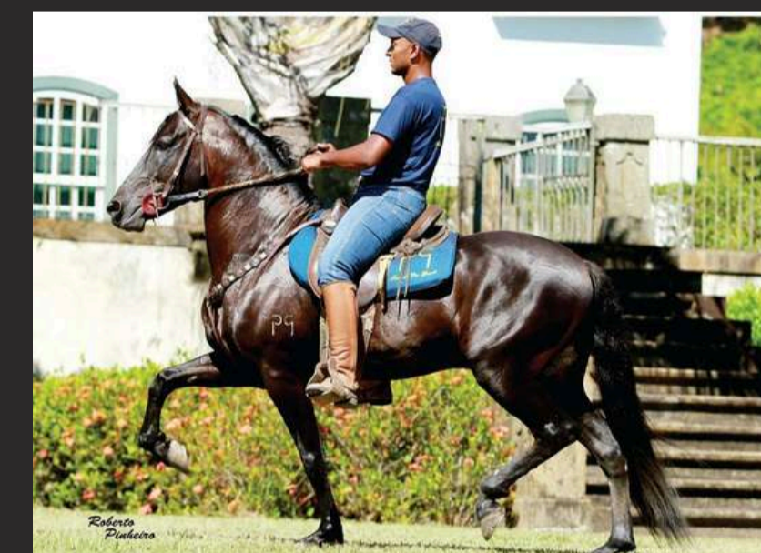
SEU AVÔ, SADDAM DA PAO GRANDE