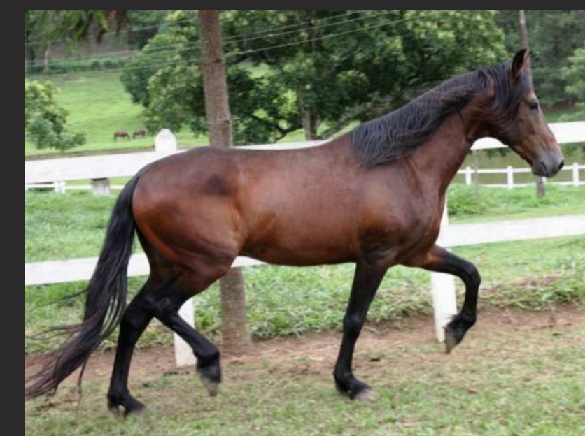
SEU PAI, QUELUZ JB