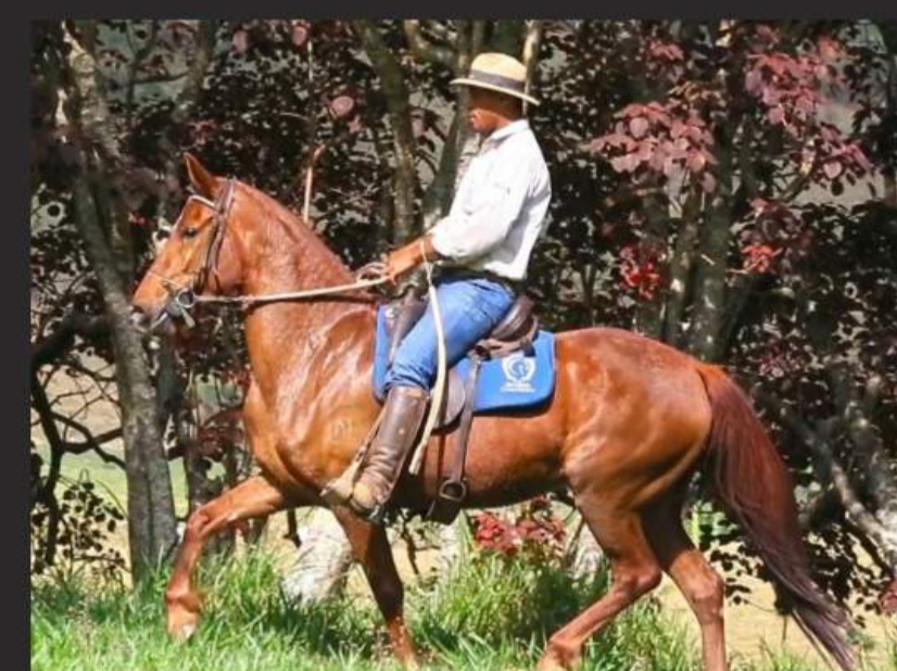
SUA MÃE, JURADA DA MORRO ALTO