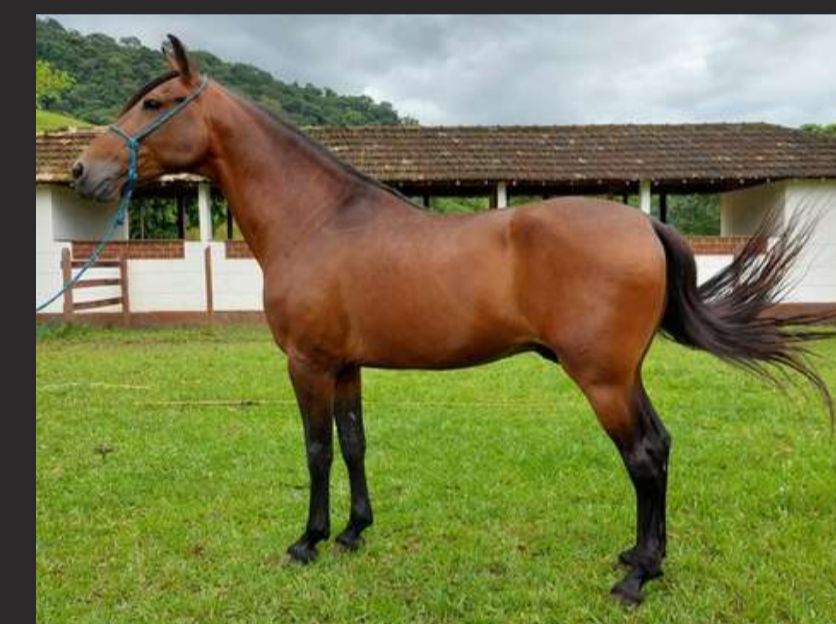
SEU PAI, QUELUZ H.B.