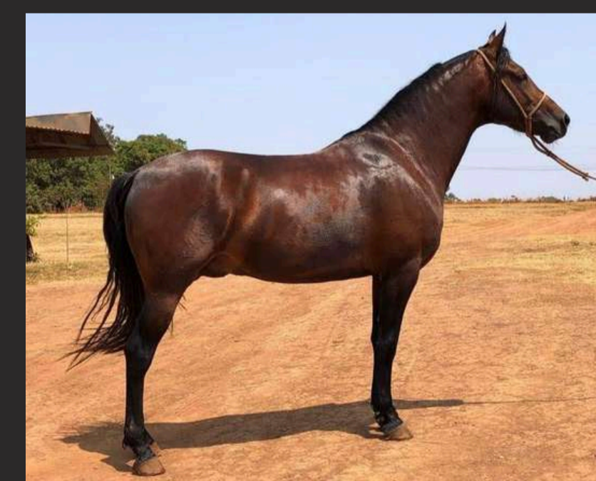
PRENHEZ POR XENON H.B.