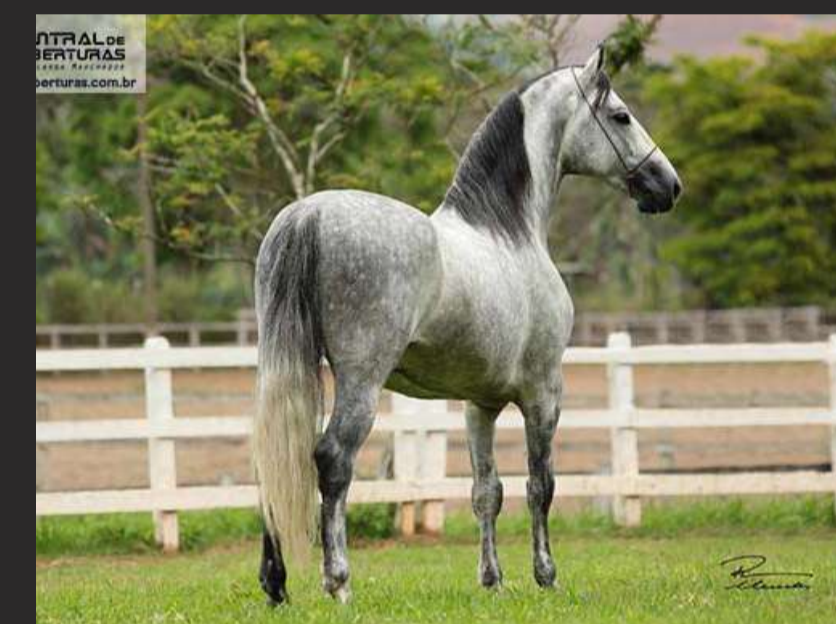
SEU PAI, FUTURO FORMOSO 2S