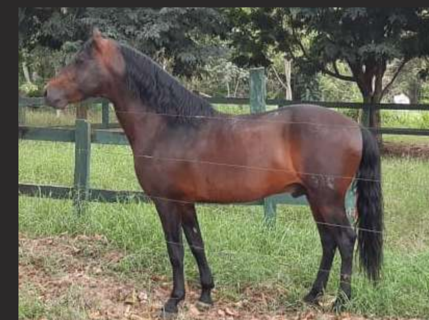
SEU PAI, PATENTE DA GIRONDA