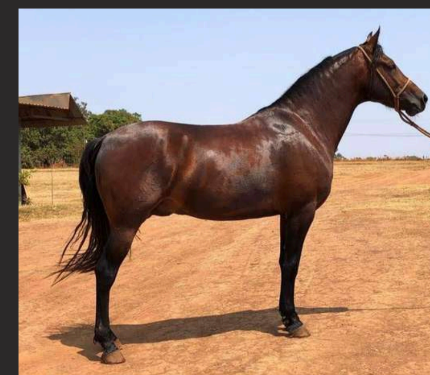
PRENHEZ POR XENON H.B.