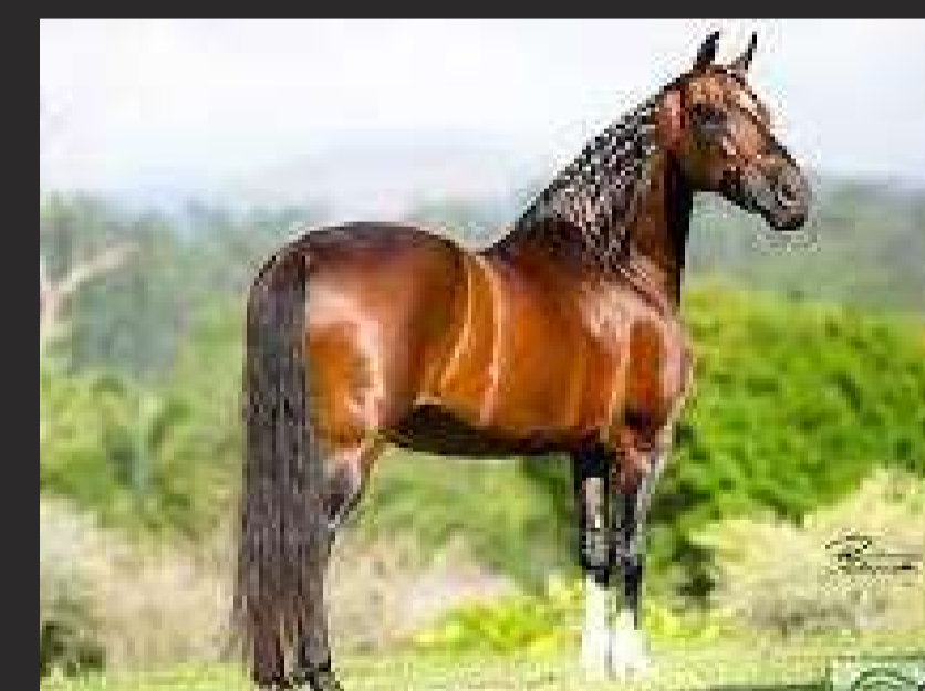
SEU AVÔ, LÓTUS DA CATIMBA

Filha do grande Futuro Formoso 2S, portanto neta do fenomenal Lótus da Catimba, pai e avô de inúmeros campeões. Em sua linha materna é neta do grande raçador Danga de Santa Jacinta e de Avelã Itioca, que por tua vez é filha de Truc da Morro Grande.