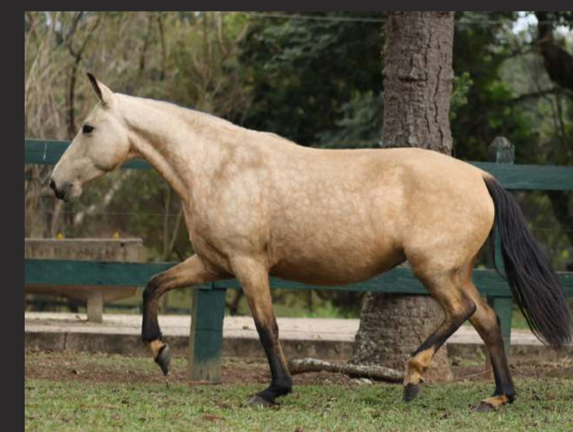
SUA MÃE, ZOOTECNIA H.B.