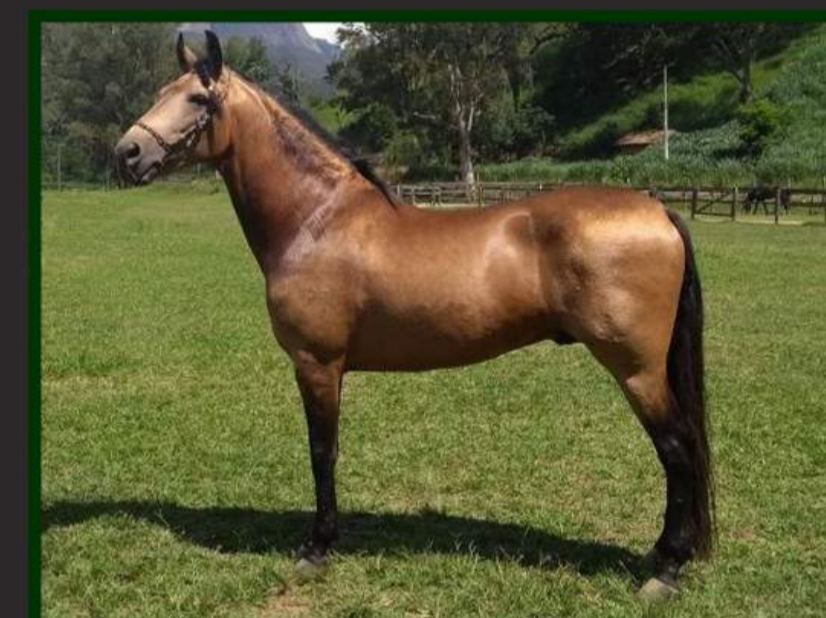
SEU PAI, ZEUS DA PAO GRANDE