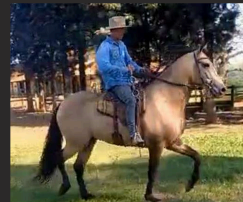
DIREITO A COBERTURA POR XERIFE DA GIRONDA