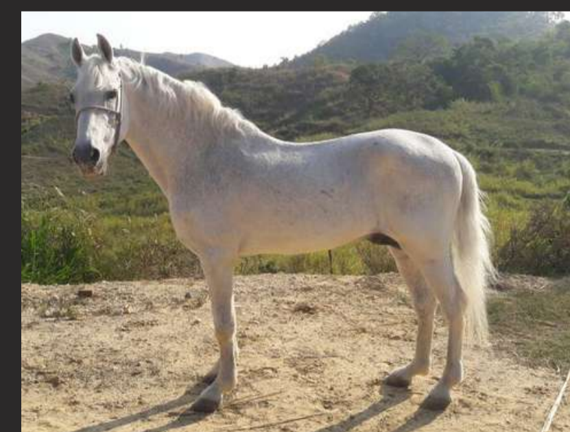
SEU AVÔ, MAFIOSO DA GIRONDA