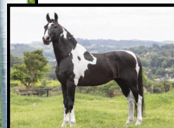
SEU BISAVÔ, BELETTI SÃO LOURENÇO