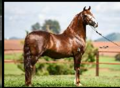
SEU AVÔ, GALANTE DO EXPOENTE