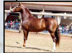
SEU PAI, DOUTOR DA CACHOEIRA