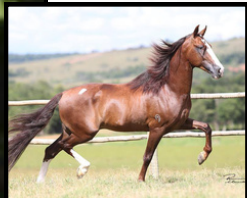
SEU PAI, FOGO DAS MINAS GERAIS