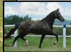
PARIDA DE FÊMEA POR, CAÇADOR MAPEJO DO BAGUAÇU