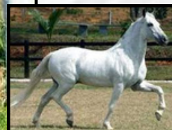
SEU BISAVÔ, NOBRE DE SANTA LÚCIA