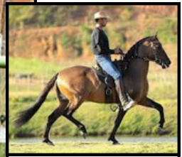
SEU PAI, CARRASCO AMALAN