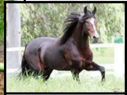
SEU BISAVÔ, GUARITÁ SEARA DOURADA