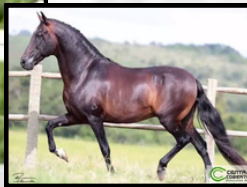
SEU AVÔ, ARGOS DAS MINAS GERAIS