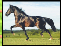
SEU AVÔ, ELFO DO PORTO AZUL