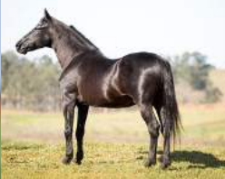
SEU AVÔ, HAITY CAXAMBUENSE