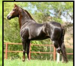
SEU PAI, MUSSOLINI DA PEDRA VERDE