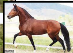
SEU AVÔ, EMBLEMA E.A.O.