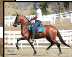
SEU PAI, GRÊMIO DO MZC