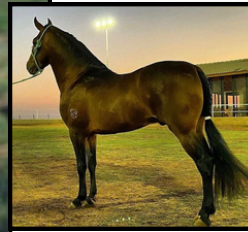
SEU PAI, FESTIVAL CABALLERO