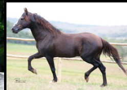
SEU AVÔ, TRILHO DA ZIZICA