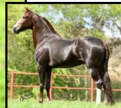
SEU PAI, MUSSOLINI DA PEDRA VERDE