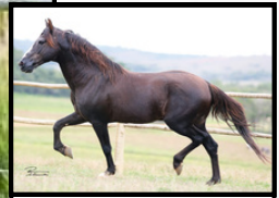
SEU AVÔ, TRILHO DA ZIZICA