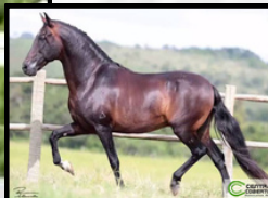
SEU AVÔ, ARGOS DAS MINAS GERAIS