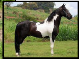
SEU AVÔ, XPTO L.J.