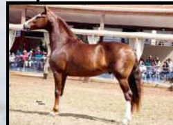
SEU PAI, DOUTOR DA CACHOEIRA