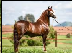
SEU AVÔ, GALANTE DO EXPOENTE