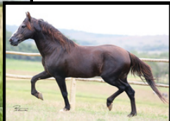
SEU AVÔ, TRILHO DA ZIZICA