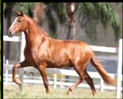
SEU PAI, TRATADO BAVÁRIA