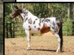
SUA MÃE, GOTA D'AGUA BOSQUE DO IÇA