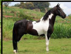
SEU AVÔ, XPTO L.J.