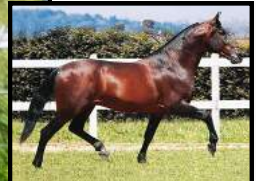
SEU AVÔ, BEIJO J.B.