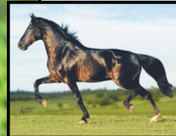
SEU PAI, ELFO DO PORTO AZUL