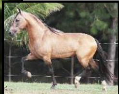
SEU PAI, COBALTO MACADU