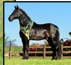
SEU PAI, IRAQUE PONTAL