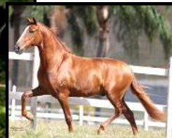
SEU PAI, TRATADO BAVÁRIA