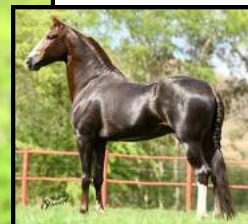
SEU PAI, MUSSOLINI DA PEDRA VERDE