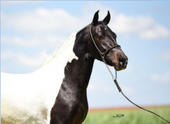
FAROLETE DA CANDELÁRIA