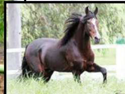
SEU BISAVÔ, GUARITÁ SEARA DOURADA