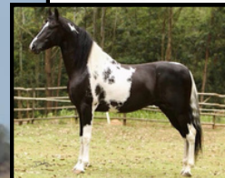
SEU PAI, CÍRCULO MÍSTICO BOSQUE DO IÇA