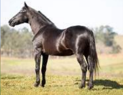
SEU AVÔ, HAITY CAXAMBUENSE