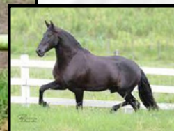
SEU AVÔ, FEITIÇO CAXAMBUENSE