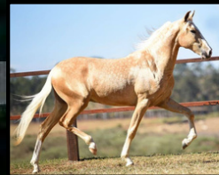
SEU PAI, CHUVISCO DO ZEL