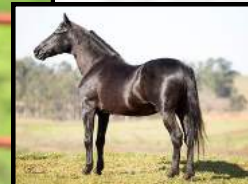
SEU BISAVÔ, HAITY CAXAMBUENSE