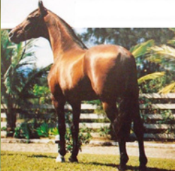
SEU BISAVÔ, HERDADE CAPRICO