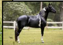
SEU PAI, ABILIDOSO DO VÔ