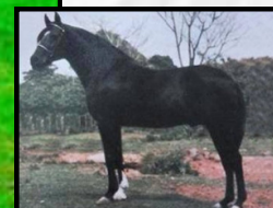
SEU AVÔ, ZINABRE DE PASSA TEMPO