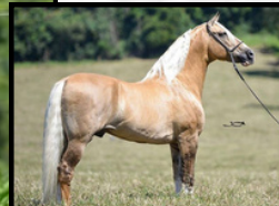
SEU AVÔ, FATOR DA CAVARÚ-RETĂ