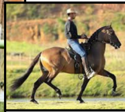
SEU PAI, CARRASCO AMALAN