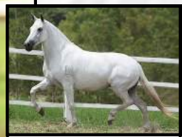
SUA MÃE, SINIRA DO BERMA