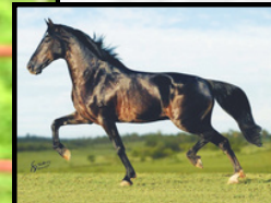
SEU AVÔ, ELFO DO PORTO AZUL