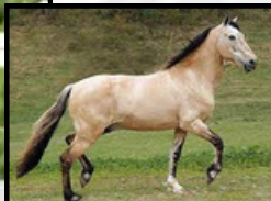
SEU BISAVÔ, FAVACHO QUOCIENTE