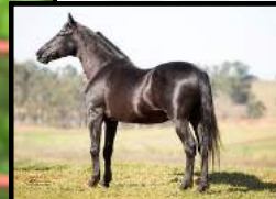
SEU AVÔ, HAITY CAXAMBUENSE