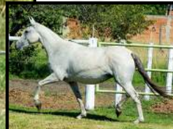
SUA MÃE, BRAHMA DO VÔ