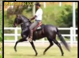
SEU AVÔ, JIPE DA MANDASSAIA