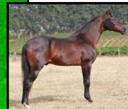
SEU PAI, DESAFIO DE PASSA TEMPO