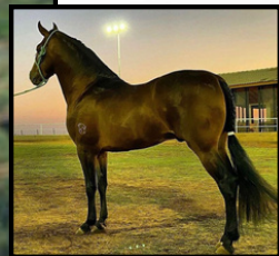
SEU PAI, FESTIVAL CABALLERO