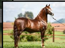
SEU AVÔ, GALANTE DO EXPOENTE