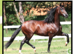
SEU PAI, SOL DBG