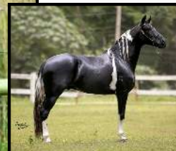
SEU PAI, ABILIDOSO DO VÔ