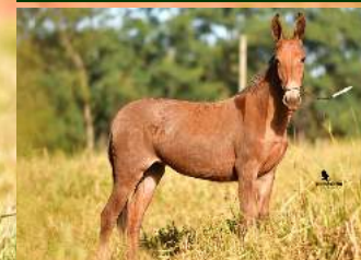
ARIZONA DO TRIBET