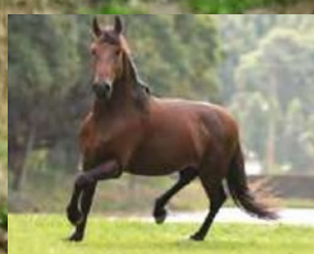
SEU PAI, TIGRÃO KAFÉ