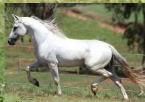
SEU AVÔ, DESEJO DO COMBOIO