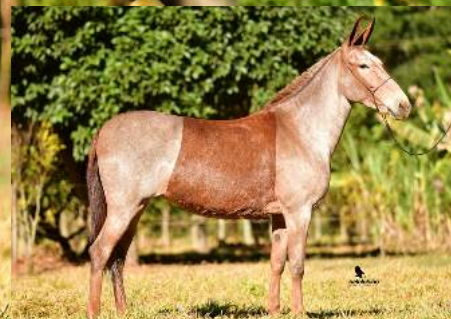
VIOLETA DO TRIBET