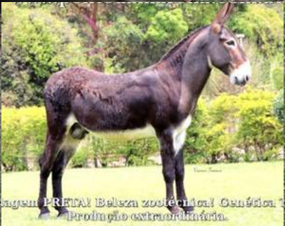
agenç PRTTA Belsza zooléchnical Genética Produção extraordinária.