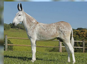
SEU PAI, HIMALAYA DA CERTEZA