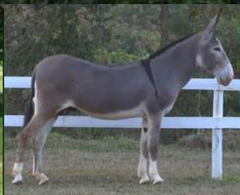
SEU PAI, RENA CADILAC