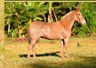
CACIQUE DA UNIFEL