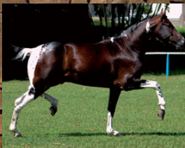
SEU PAI, HAITI R.M.