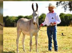
QUARTEL DA CERTEZA