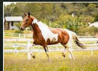
SEU BISAVÔ, DUELO DO ENGENHO DE SERRA