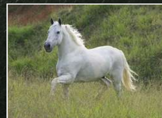
SEU BISAVÔ, GALEÃO DA OGAR