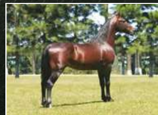
SEU BISAVÔ, BEIJO J.B.