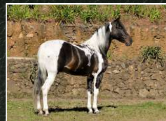
SEU PAI, TALENTO DA SANTA ESMERALDA