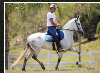
SUA AVÓ, UVÁIA DA BOA FÉ