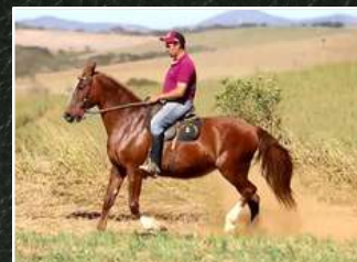
SUA AVÓ, JÓIA DO ENGENHO DE SERRA