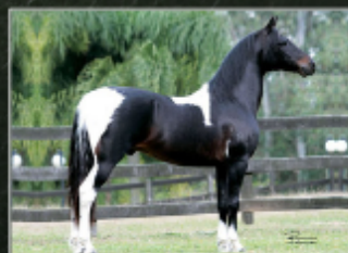
SEI BISAVÔ, EXTRATO DO MINATTO