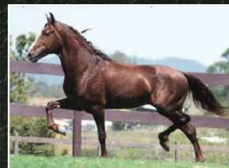
SEU AVÔ, LOBINHO LOBOS