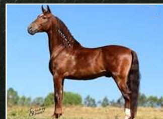
PRENHEZ POR MARECHAL JLPE 01/02/2025