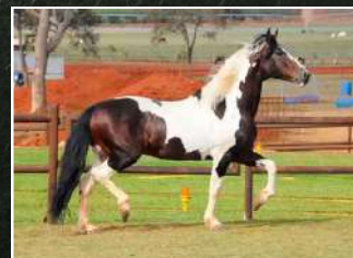
SEU BISAVÔ, ELO KAFÉ DA NOVA