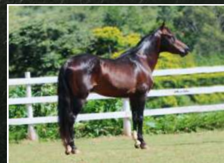
PRENHEZ POR GATO CECAVE 10/03/2025