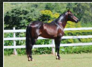
VAI PARIDA DE POTRO MACHO DE NOME POSEIDON CECAVE, NASCIDO NO DIA 10/01/2026, FILHO DE GATO CECAVE