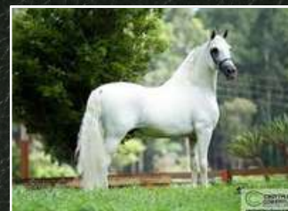
SEU PAI, RÁPIDO EL FAR