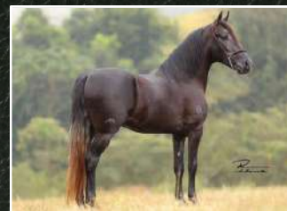
SEU PAI, ESPÁZIO ELFAR