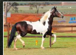
SEU BISAVÔ, ELO KAFÉ DA NOVA