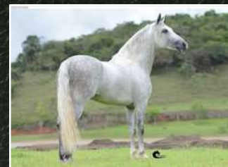
SEU PAI, FIDALGO FORUM LUXOR