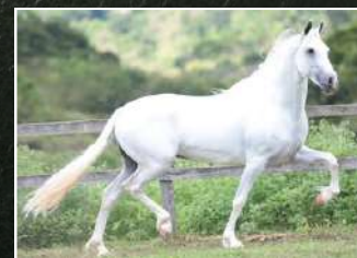
SEU AVÔ, SHAKE ELFAR