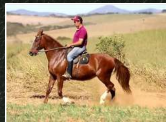
SUA AVÓ, JÓIA DO ENGENHO DE SERRA