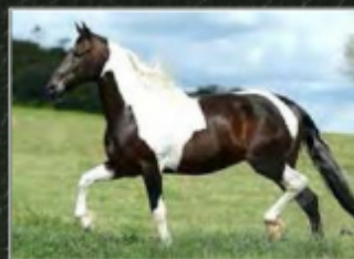
SEU AVÔ, BUIK DA CASA NOVA