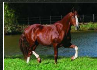
SEU AVÔ, ALMANAQUE S.J.N.