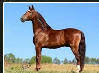
PRENHEZ POR MARECHAL JLPE 25/01/2025