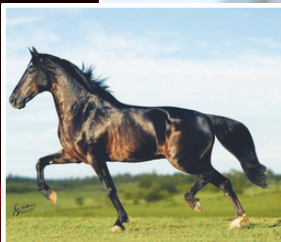
SEU AVÔ, ELFO DO PORTO AZUL