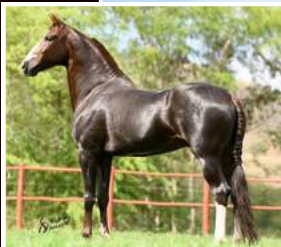
SEU PAI, MUSSOLINI DA PEDRA VERDE