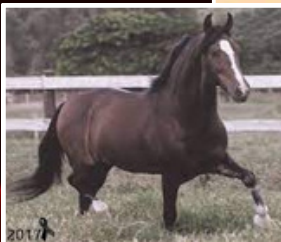
SEU AVÔ, FAVACHO ÚNICO