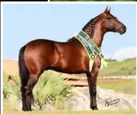
SEU PAI, OURIÇO DO MONTEIRO