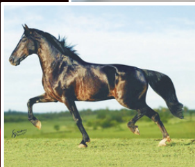
SEU AVÔ, ELFO DO PORTO AZUL