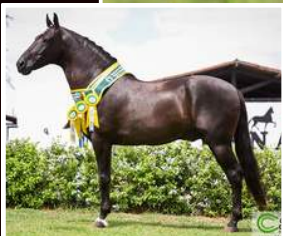
SEU PAI, SELVAGEM DE MAIRI