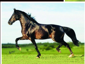
SEU AVÔ, ELFO DO PORTO AZUL