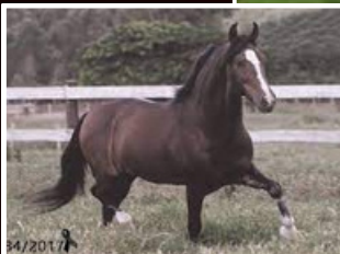
SEU PAI, FAVACHO ÚNICO

PACOTE DE 3 COBERTURAS 35 PARCELAS MENSIS DE R$300,00