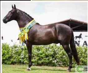
SEU PAI, SELVAGEM DE MAIRI