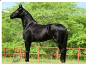
SEU PAI, PINTOR DO MONTEIRO