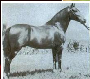
SEU AVÔ, HERDADE TEATRO