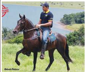
SEU AVÔ, RADIANTE FORUM