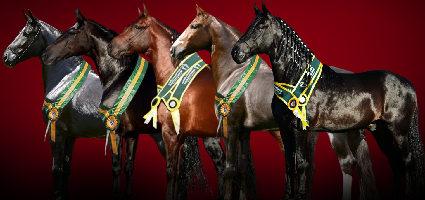
Quintal do Monteiro

7 Vezes Melhor Criador Expositor Nacional MARCHA PICADA