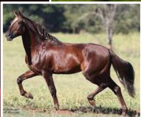
SEU AVÔ, ENFEITE D2