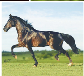
SEU PAI, ELFO DO PORTO AZUL