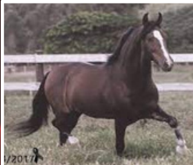
SEU AVÔ, FAVACHO ÚNICO