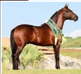
SEU PAI, OURIÇO DO MONTEIRO