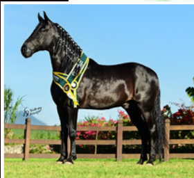
SEU PAI, IRAQUE PONTAL