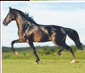
SEU AVÔ, ELFO DO PORTO AZUL