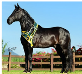
SEU PAI, IRAQUE PONTAL