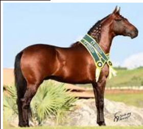
SEU PAI, OURIÇO DO MONTEIRO