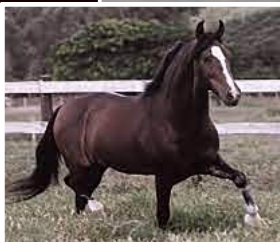
SEU AVÔ, FAVACHO ÚNICO