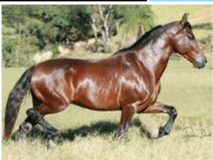
SEU PAI, CRAVO AF