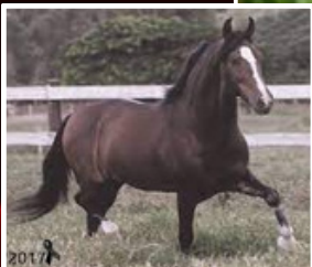
SEU AVÔ, FAVACHO ÚNICO