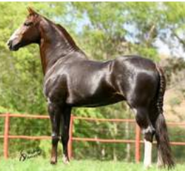
SEU PAI, MUSSOLINI DA PEDRA VERDE