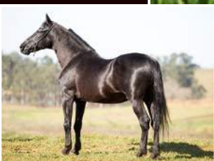
SEU AVÔ, HAITY CAXAMBUENSE