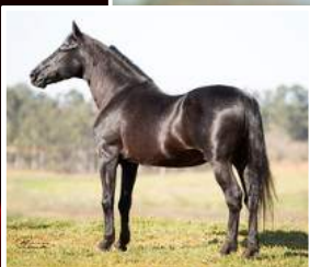
SEU AVÔ, HAITY CAXAMBUENSE