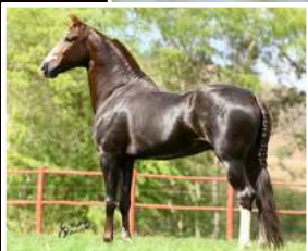
SEU PAI, MUSSOLINI DA PEDRA VERDE