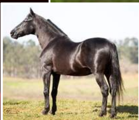
SEU AVÔ, HAITY CAXAMBUENSE