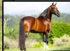
SEU AVÔ, LÓTUS DA CATIMBA