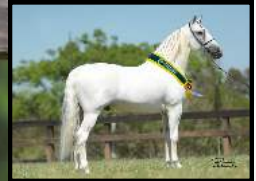
SEU PAI, TEXTOR ELEGANTE