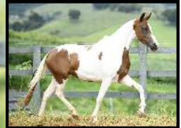
SUA MÃE, BRASA HRP