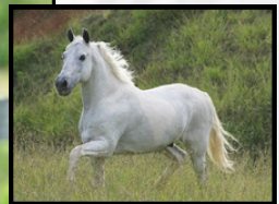
SEU BISAVÔ, GALEÃO DA OGAR