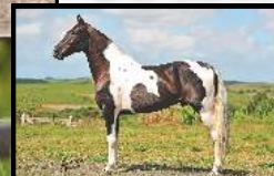
SEU AVÔ, TRIUNFO DO PORTO PALMEIRA