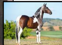
SEU PAI, FALCÃO DO ZEL