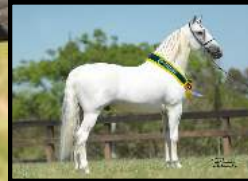
SEU PAI, TEXTOR ELEGANTE