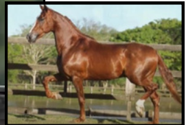
SEU PAI, GOIANDIRA PIONEIRO DO NARCISO