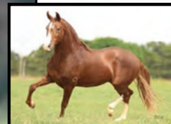
SEU PAI, ATREVIDO DA MORADA NOVA