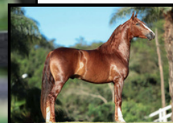
SEU PAI, FAJARDO DO TIMBÓ