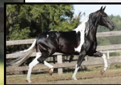
SEU AVÔ, TRIUNFO DO PORTO PALMEIRA