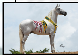
PRENHEZ POR PIRATA E.A.O