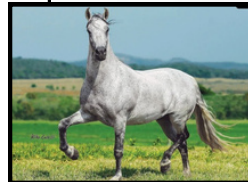
SEU PAI, CASTIÇO CARÍBIA