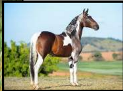
SEU PAI, FALCÃO DO ZEL