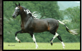
SEU AVÔ, SUBLIME DA OGAR