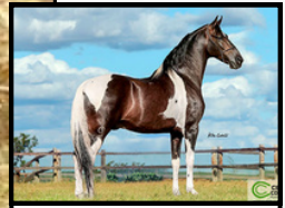
SEU PAI, DELETE CAXAMBUENSE