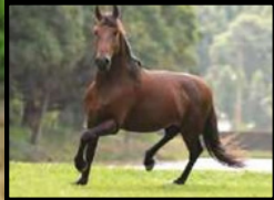
SEU PAI, TIGRÃO KAFÉ