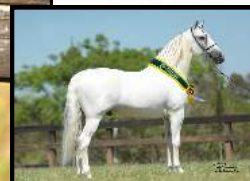
SEU PAI, TEXTOR ELEGANTE