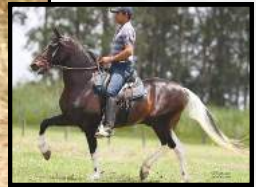
SEU AVÔ, COMBOIO DO EXPOENTE