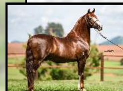
SEU AVÔ, GALANTE DO EXPOENTE