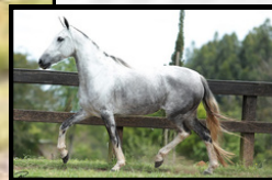
SUA MÃE, TEXTOR ELÂN