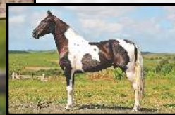
SEU AVÔ, TRIUNFO DO PORTO PALMEIRA