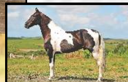
SEU AVÔ, TRIUNFO DO PORTO PALMEIRA