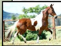
SEU AVÔ, CABOCLA DAS RUINAS