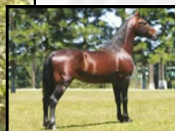
SEU AVÔ, BEIJO J.B.