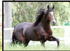
SEU PAI, GUARITÁ SEARA DOURADA