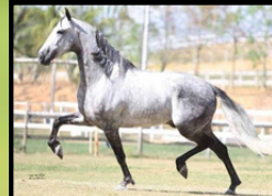
SEU PAI, LAÇADOR DE ALCATÉIA