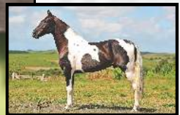
SEU AVÔ, TRIUNFO DO PORTO PALMEIRA