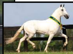
SEU PAI, TEXTOR ELEGANTE