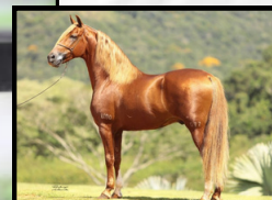
SEU AVÔ, ESTANHO DE ALCATEIA