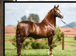
SEU AVÔ, GALANTE DO EXPOENTE