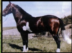
SEU AVÔ, PALHAÇO DE ITUVERAVA