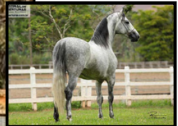
SEU PAI, FUTURO FORMOSO 2S