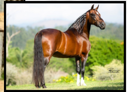
SEU AVÔ, LÔTUS DA CATIMBA