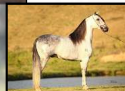
SEU PAI, PALHAÇO PORTEIRA AZUL