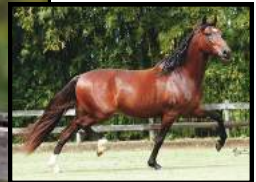
SEU PAI, GINETE MEUS AMORES