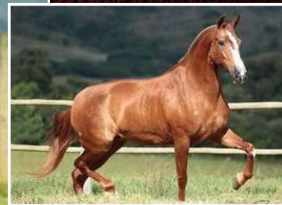
SUA MÃE, DEVASSA LUA DE PRATA

TEOREMA DA MORADA NOVA X DEVASSA LUA DE PRATA