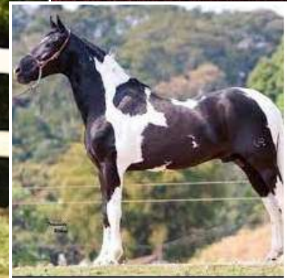
SEU BISAVÔ, CAXAMBU OURO PRETO