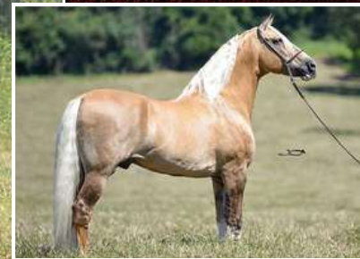
SEU AVÔ, FATOR DA CAVARÚ-RETÃ