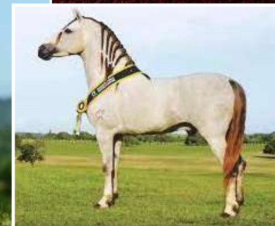
SEU IRMÃO, ELDORADO DA BOA TERRA

LÓTUS DA CATIMBA X COLÔMBIA DO QUOCIENTE