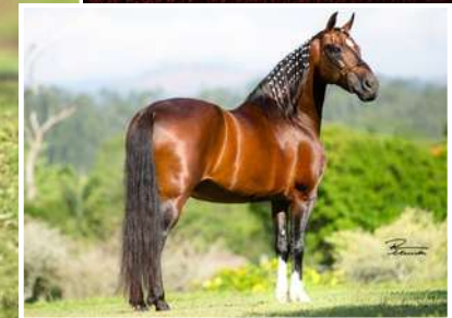
SEU AVÔ, LÓTUS DA CATIMBA