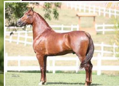
SEU PAI, ROLO BAVÁRIA,