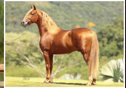
SEU PAI, ESTANHO DE ALCATÉIA