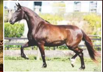
SUA MÃE, SAPECA DA PAO GRANDE

ESTANHO DE ALCATÉIA X SAPECA DA PAO GRANDE