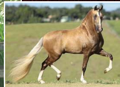
SEU PAI, ULISSES MEAÍPE