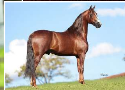
SEU AVÔ, VETTEL DO YURI