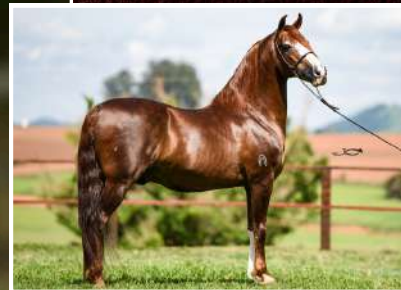
SEU PAI, GALANTE DO EXPOENTE