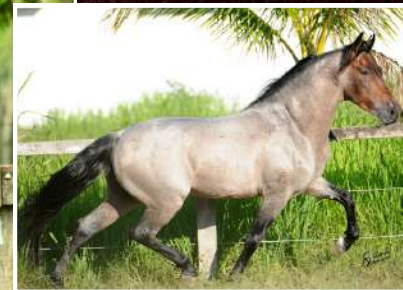
SEU PAI, ITAPARICA LIDER