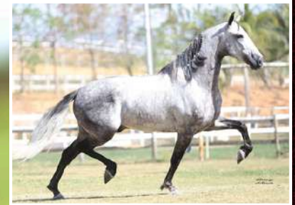
SEU PAI, LAÇADOR DE ALCATÉIA