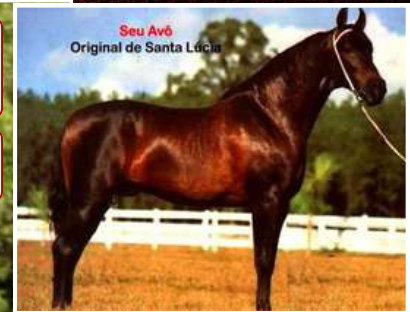
Seu Avô Original de Santa Lúcia