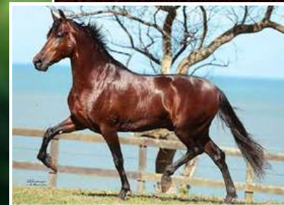
SEU PAI, SONHO DO PORTO AZUL