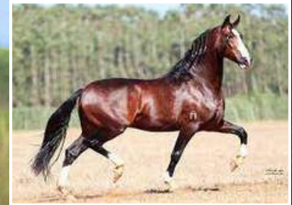
SEU PAI, TEOREMA DA MORADA NOVA