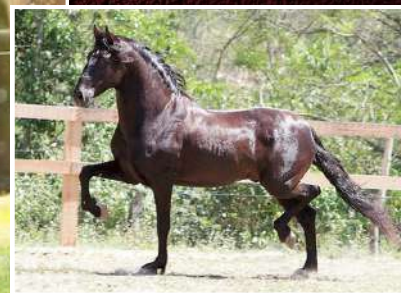
SEU AVÔ, JABUTI DA MANDASSAIA