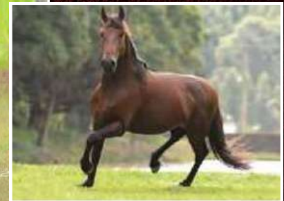
SEU AVÔ, TIGRÃO KAFÉ

TEOREMA DA MORADA NOVA X ODARA DA ALDEIA