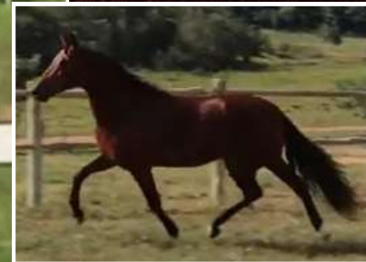
SEU PAI, ABRIGO SERRA BELA