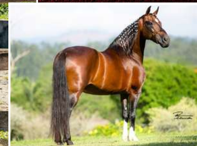
SEU AVÔ, LÓTUS DA CATIMBA