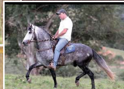
SEU PAI, DESEJO NARCISO