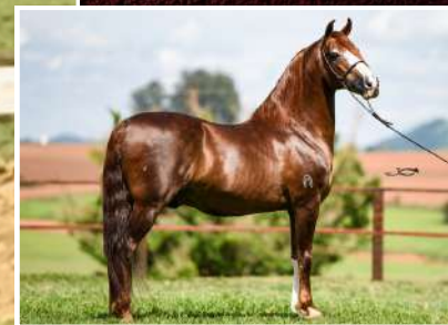
SEU BISAVÔ, GALANTE DO EXPOENTE