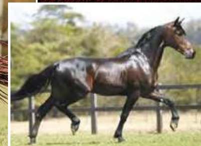
SEU AVÔ, GRECO DO YURI

LOBINHO LOBOS X URUGUAIANA DA SANTA ESMERALDA