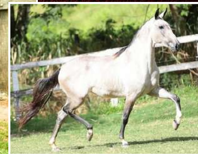
SUA MÃE, ODISSÉIA DO PARAÍSO PERDIDO

ITAPARICA LIDER X ODISSÉIA DO PARAÍSO PERDIDO