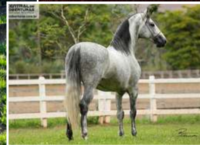
SEU PAI, FUTURO FORMOSO 2S