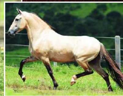
SEU BISAVÔ, FAVACHO ESTANHO

ÔNIX DO LUMIAR X JÓIA RARA DO PARAÍSO PERDIDO