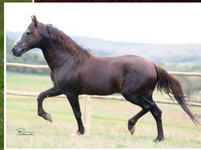
SEU AVÔ, TRILHO DA ZIZICA

GALANTE DO EXPOENTE X DEMOLIDORA BAVÁRIA