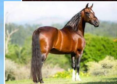
SEU PAI, LÓTUS DA CATIMBA