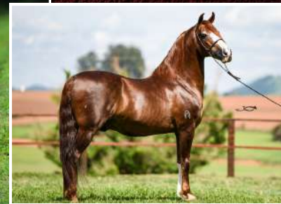
SEU AVÔ, GALANTE DO EXPOENTE

SONHO DO PORTO AZUL X FLOR DO CAMPO DO PORTO AZUL GALANTE DO EXPOENTE x MALVADA BAVÁRIA ARA TERREMOTO x PECADORA DO PORTO AZUL