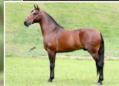
SEU PAI, ÔNIX DO LUMIAR