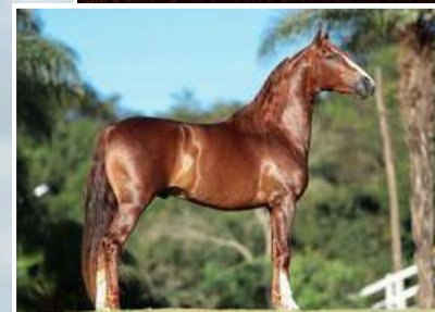
SEU IRMÃO, FAJARDO DO TIMBÓ