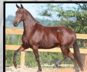
SUA AVÓ, XANGRILÁ CAXAMBUENSE