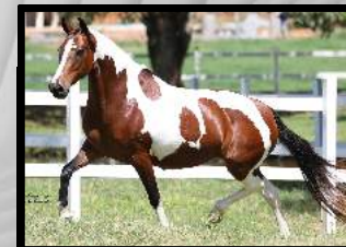
SUA AVÓ, ÚNICA KAFÉ