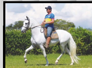
SEU PAI, OLODUM DA BOA FÉ