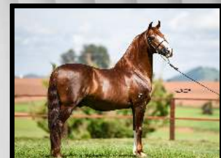
SEU PAI, GALANTE DO EXPOENTE