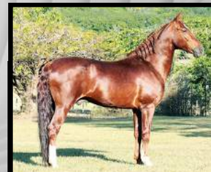
SEU AVÔ, ORIXÁ DE PATROCÍNIO