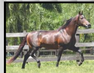
SEU AVÔ, CABUÇU DA SELVA MORENA