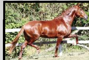
SEU PAI, HIMALAYA CAXAMBUENSE