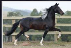
IGUAÇU DO EXPOENTE