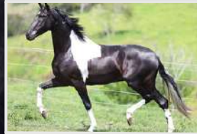
DEMOLIDOR DA PAO GRANDE