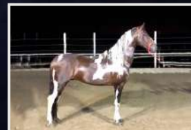
ÍCARO DO EXPOENTE