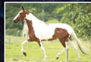
ÚNICA KAFÉ TN2