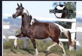
FAGULHA DO EXPOENTE