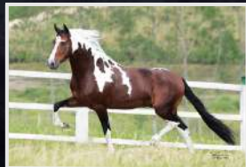
FETIÇO DO EXPOENTE