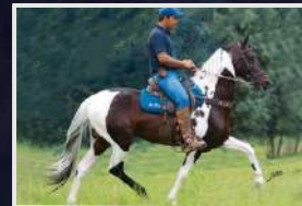
HAITIANO DO EXPOENTE