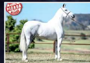
SUA MÃE, AUSTRIA DO ZEL