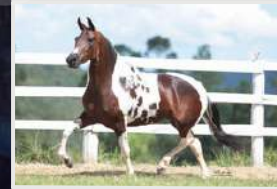
ESMERALDA DA FIGUEIRA