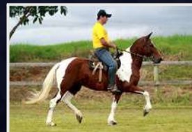
FEITICEIRA DO EXPOENTE