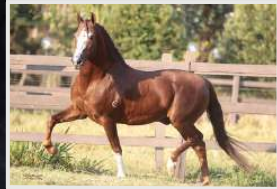
GALANTE DO EXPOENTE