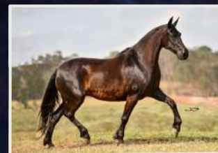
SUA MÃE, KASTANHOLA DO ZEL