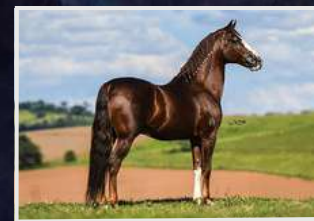
GALANTE DO EXPOENTE