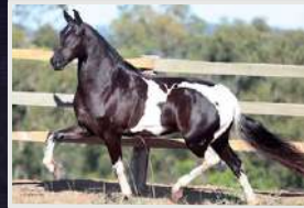
GALILEIA DO EXPOENTE