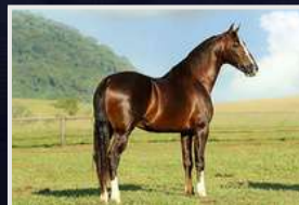
CHARMOSO DO SUSPIRO