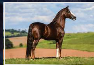
SEU PAI, GALANTE DO EXPOENTE