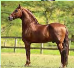
SEU PAI, IGAPÓ SG