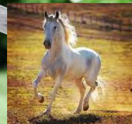
SEU AVÔ, TRAITUBA BRINQUEDO