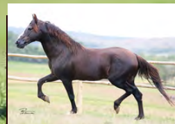
SEU AVÔ, TRILHO DA ZIZICA