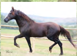
SEU AVÔ, TRILHO DA ZIZICA