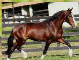
SEU PAI, ANGAI EUFRATES