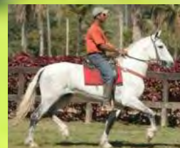
SEU PAI, TRAITUBA ZORRO