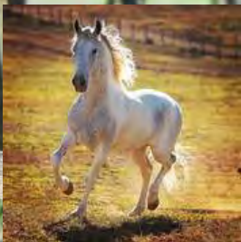
SEU AVÔ, TRAITUBA BRINQUEDO