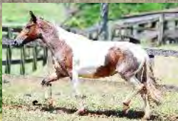
SUA MÃE, QUERÊNCIA SG