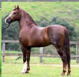
SEU PAI, PLAYBOY SG