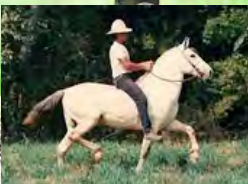
SEU BISAVÔ, TRUC DO MORRO GRANDE