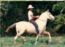
SUA AVÓ, TRUC DO MORRO GRANDE