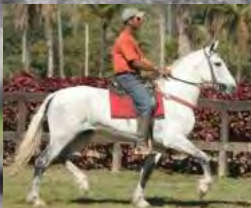
SEU PAI, TRAITUBA ZORRO