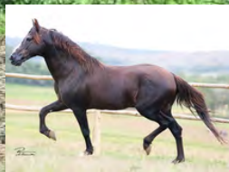
SEU AVÔ, TRILHO DA ZIZICA