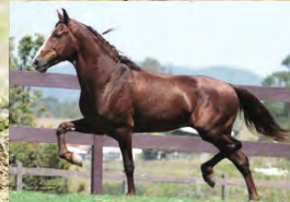
SEU BISAVÔ, LOBINHO LOBOS