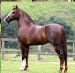
SEU PAI, PLAYBOY SG