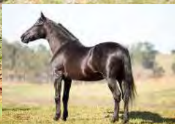
SEU BISAVÔ, HAITY CAXAMBUENSE