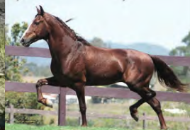
SEU AVÔ, LOBINHO LOBOS