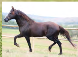
SEU AVÔ, TRILHO DA ZIZICA