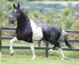
SEU PAI, ROMEIRO DA TODAY