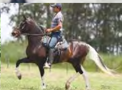
SEU AVÔ, COMBOIO DO EXPOENTE