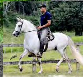
SEU PAI, NAIPE SG