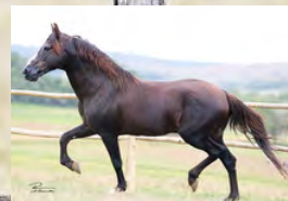
SEU AVÔ, TRILHO DA ZIZICA