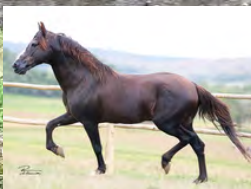
SEU AVÔ, TRILHO DA ZIZICA