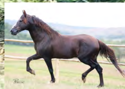
SEU AVÔ, TRILHO DA ZIZICA