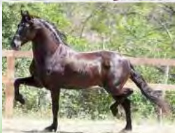
SEU PAI, JABUTI DA MANDASSAIA