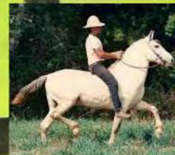
SEU AVÔ, TRUC DO MORRO GRANDE