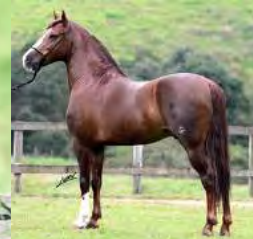
SEU PAI, PLAYBOY SG