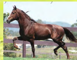
SEU AVÔ, LOBINHO LOBOS