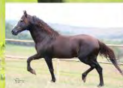
SEU AVÔ, TRILHO DA ZIZICA