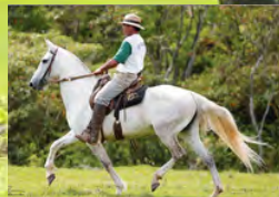
SUA BISAVÔ, COPA DO MORRO GRANDE