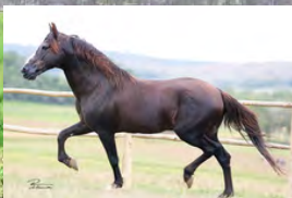
SEU AVÔ, TRILHO DA ZIZICA