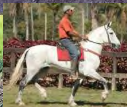
SEU AVÔ, TRAITUBA ZORRO