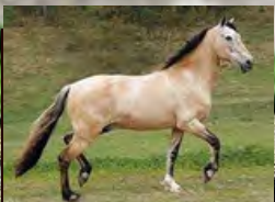
SEU BISAVÔ, FAVACHO QUOCIENTE