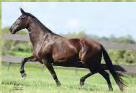
SUA MÃE, NEGRA DA SANTA ESMERALDA