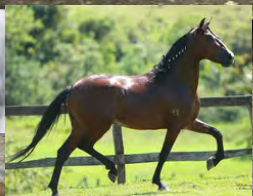
SEU PAI, SHEIK SG