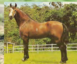
SEU BISAVÔ, HERDADE CADILAC