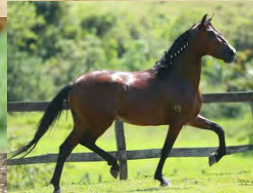
SEU PAI, SHEIK SG