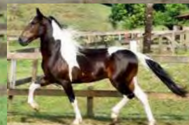
SEU PAI, TRAITUBA GLADIADOR