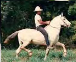
SEU AVÔ, TRUC DO MORRO GRANDE