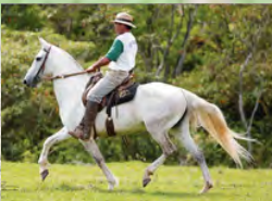
SEU BISAVÔ, COPA DO MORRO GRANDE