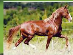
SEU PAI, QUEBRANTO RECANTO ALEGRE