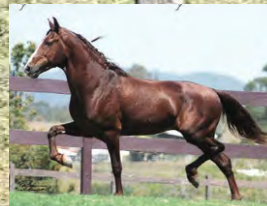
SEU PAI, LOBINHO LOBOS