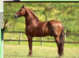
SEU PAI, IGAPÓ SG