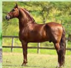
SEU PAI, IGAPO SG