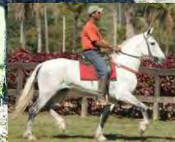
SEU AVÔ, TRAITUBA ZORRO