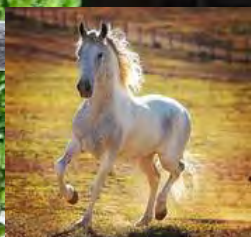
SEU AVÔ, TRAITUBA BRINQUEDO