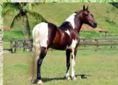
PAI DA POTRA, RABUGENTO SG