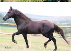
SEU AVÔ, TRILHO DA ZIZICA