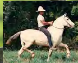
SEU AVÔ, TRUC DO MORRO GRANDE