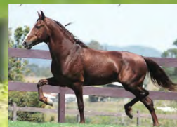
SEU AVÔ, LOBINHO LOBOS